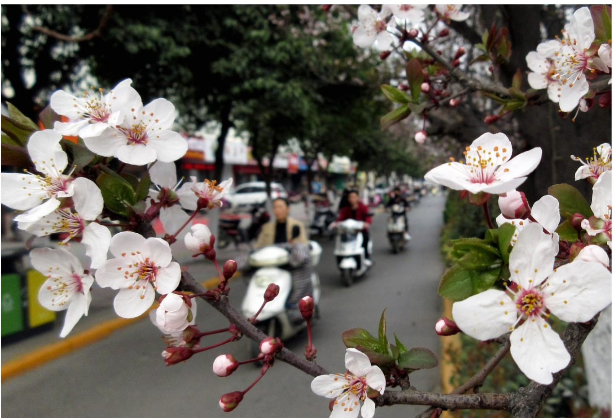
3月18日,市区莲城大道,素雅清新的李花迎风绽放,散发着醉人的芳香。近年来,我市始终坚持绿色发展理念,持续推进生态文明建设,人居环境不断改善,彰显出城市特有魅力。

禹州市加强中青年干部培养 今年以来,禹州市组织科级以上中青年干部不断加强学习,增强干事创业本领,以实际行动推动禹州高质量发展。