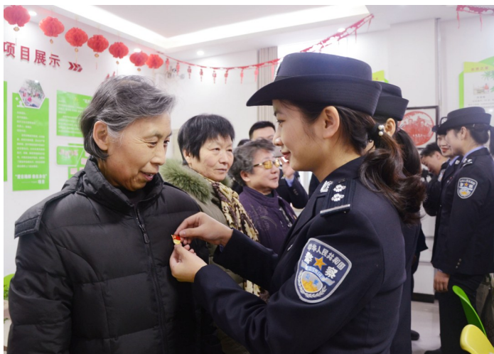
3月17日,市公安局魏都分局民警为社区老党员佩戴党徽。当天该局民警来到魏都区南关街道办事处七社区,开展“戴党徽,送党章”活动。

植树造林,美化家园,栽植仅仅是个基础,是个开端,后续的管理工作更为重要。我们要有种树植绿的热情,更要有常年爱绿、护绿意识,守护好原来的“绿”,呵护好新添的“绿”,树木才能茁壮成长,莲城才会更加绿意盎然。