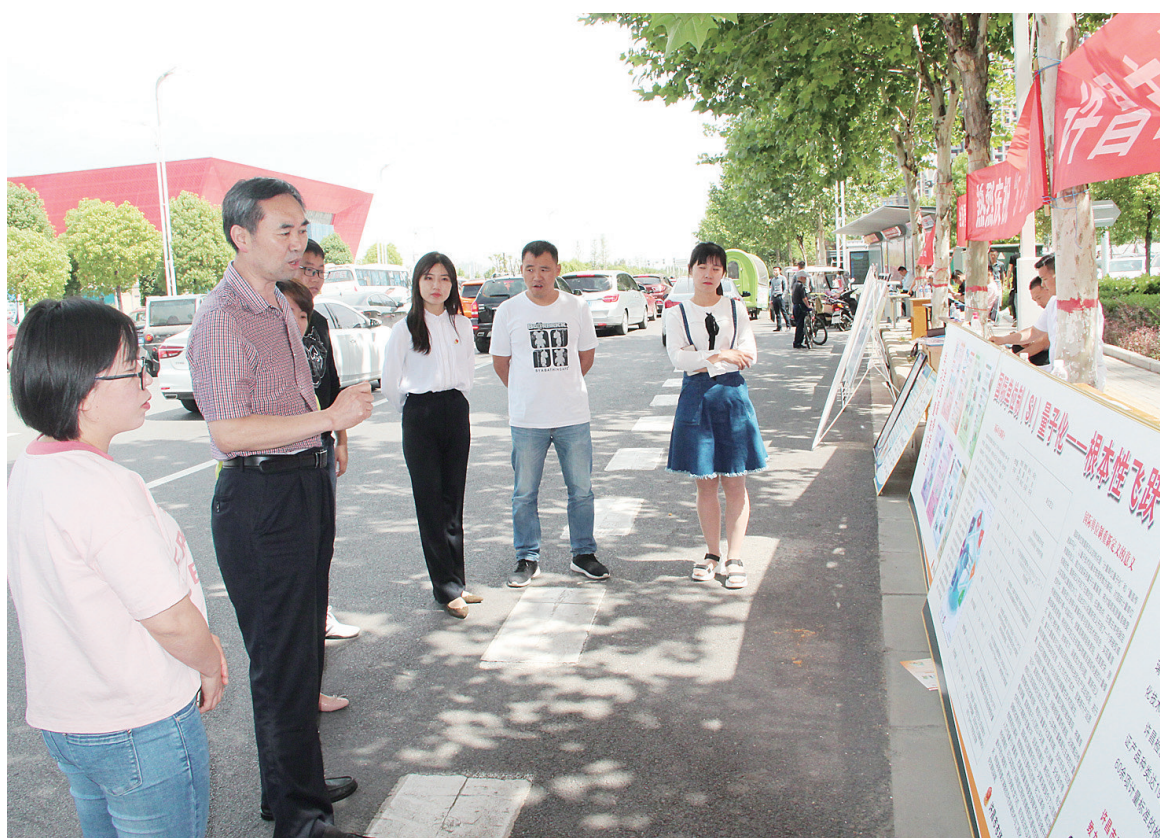
5月20日是世界计量日,今年世界计量日的主题为“国际单位制(SI)——根本性飞跃”。当天,市市场监督管理局组织全市水、电、燃气行业,医疗卫生、眼镜制配行业,计量器具制造和检定行业等12家单位,在市科技馆开展宣传活动,共展出30多块宣传版面,发放近800份宣传页。图为当日,许昌国家质检中心工作人员向市民讲解国际单位制等计量科学知识。

此次发布会由总工会、团市委、市妇联、市工信局、市科学技术协会、市质量协会联合主办。据悉,我市QC小组活动已开展30余年。近年来,我市的QC小组活动形成了由多个部门和单位联合推进、各行业全面支持的完整的组织网络和工作体系,建立了行之有效的推进机制,采取了一系列激励政策和指导措施,在工业制造、烟草、电力、能源、工程建设、商业服务等各个领域得到快速发展,展现了勃勃生机和强大的生命力,成为我市质量领域开展时间最长、参加人数最多、取得成效最显著的一项群众性质量活动。2019年质量管理活动的主题是“全员参与、质量提升”,本年度QC成果从我市多个行业、企业的多项QC成果中选拔而来,广泛地代表了企业质量管理水平。