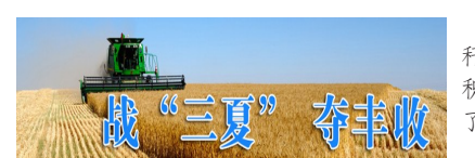
6月4日,建安区河街乡槐大庙村,一秸秆还田机正在作业。目前,我市各地农民正积极实施秸秆回收、秸秆粉碎还田,有效杜绝了秸秆焚烧造成的大气污染。