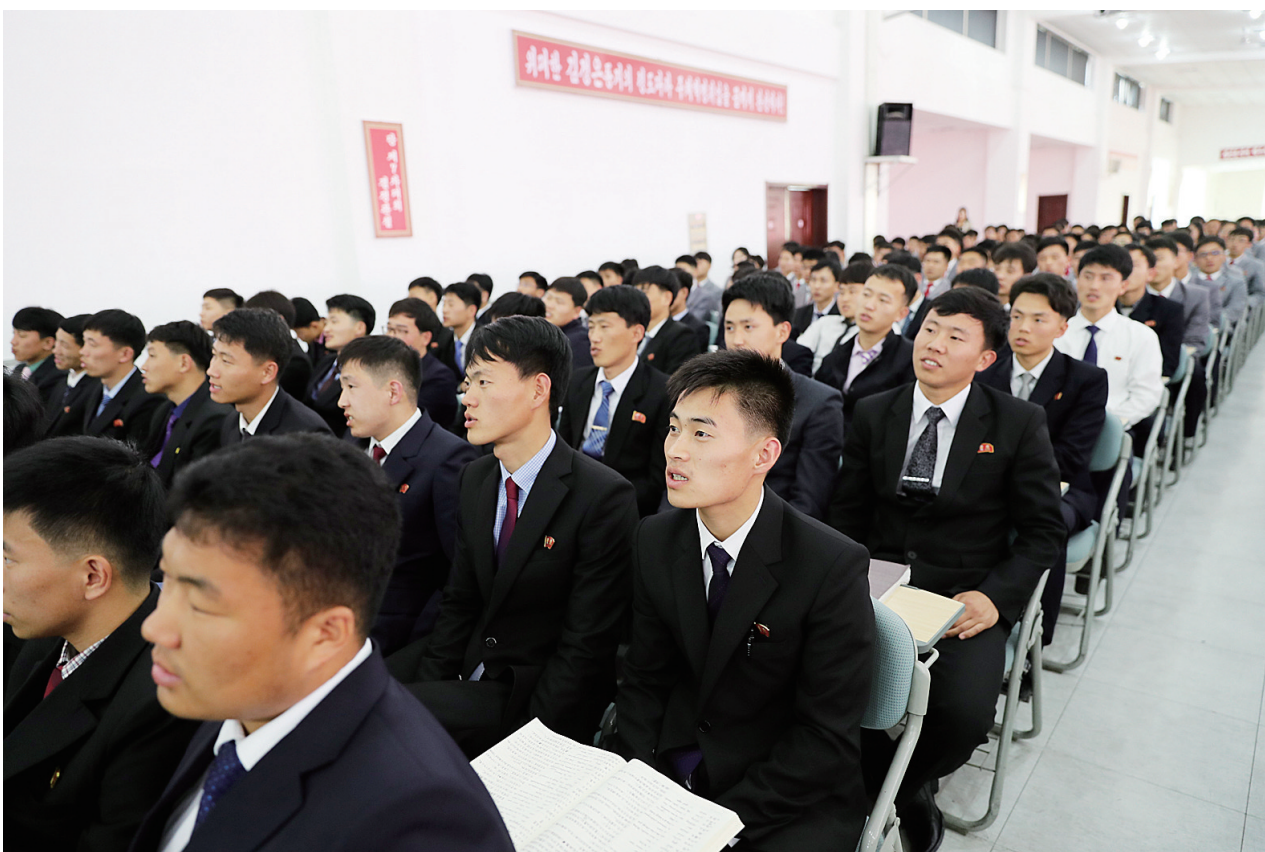
近年来，中朝教育交流合作日趋活跃。这是2019年5月7日在朝鲜平壤科技大学拍摄的汉语水平考试中心揭牌仪式现场。