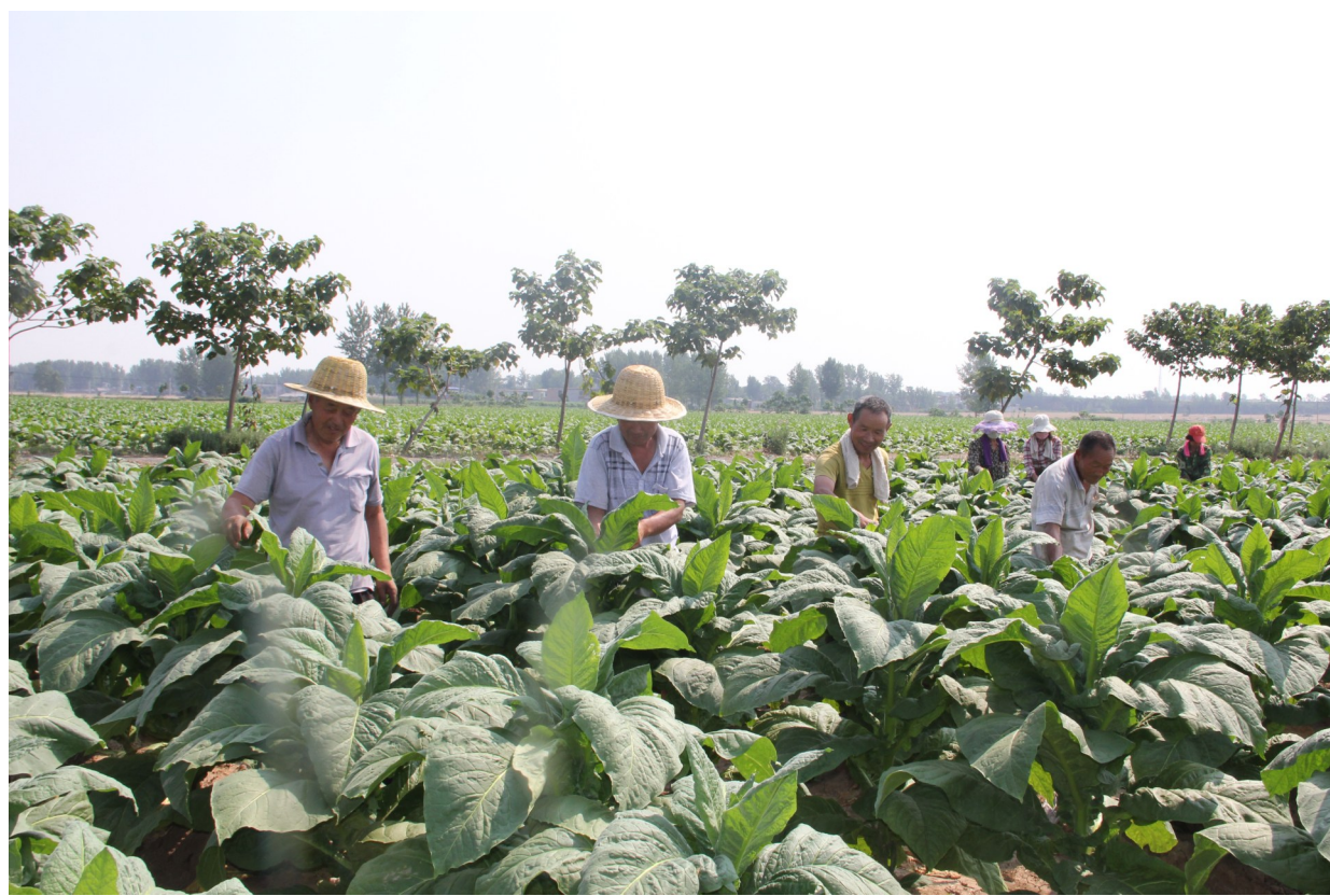
6月18日,襄城县山头店镇上秦村烟农在千亩示范烟田为烟叶打杈、平头。为确保烟叶优质丰产,该镇通过党建引领,组织技术人员,指导烟农喷药治虫、锄草施肥。目前该镇烟叶长势喜人,丰收在望。