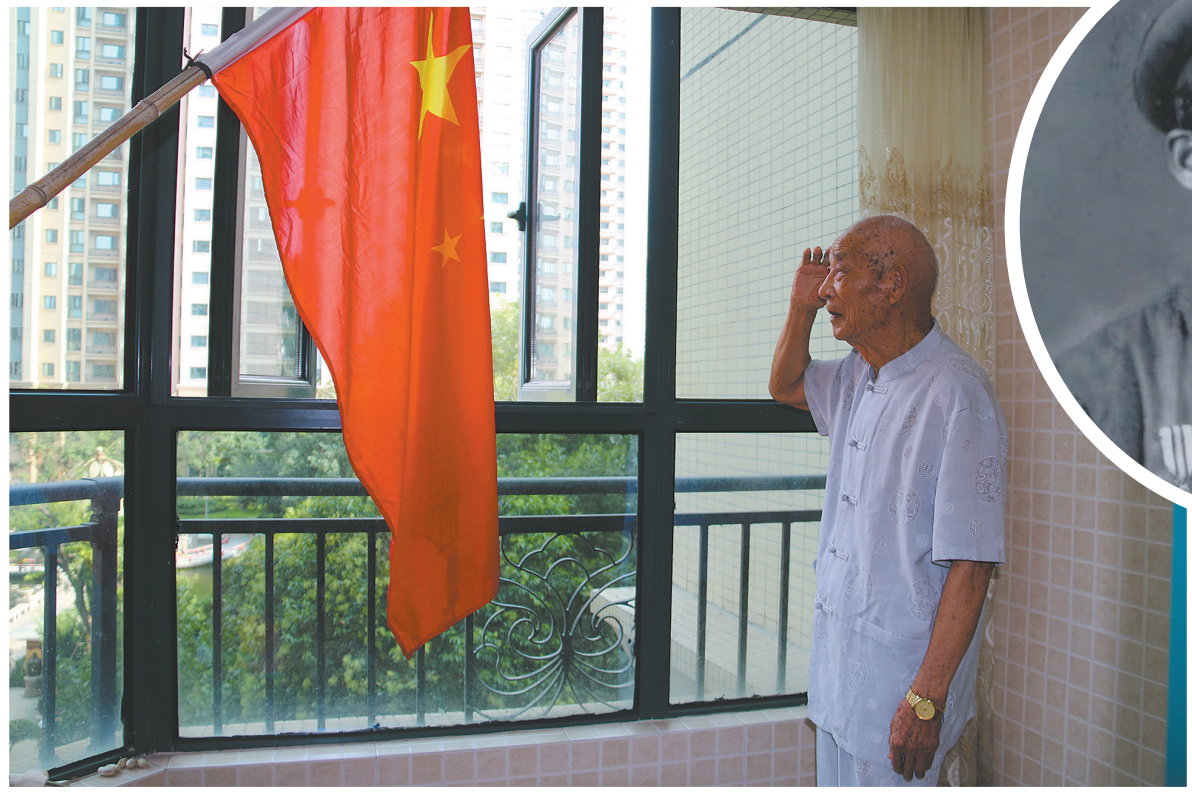
▲武丙水1950年国庆节留影。(资料图片)