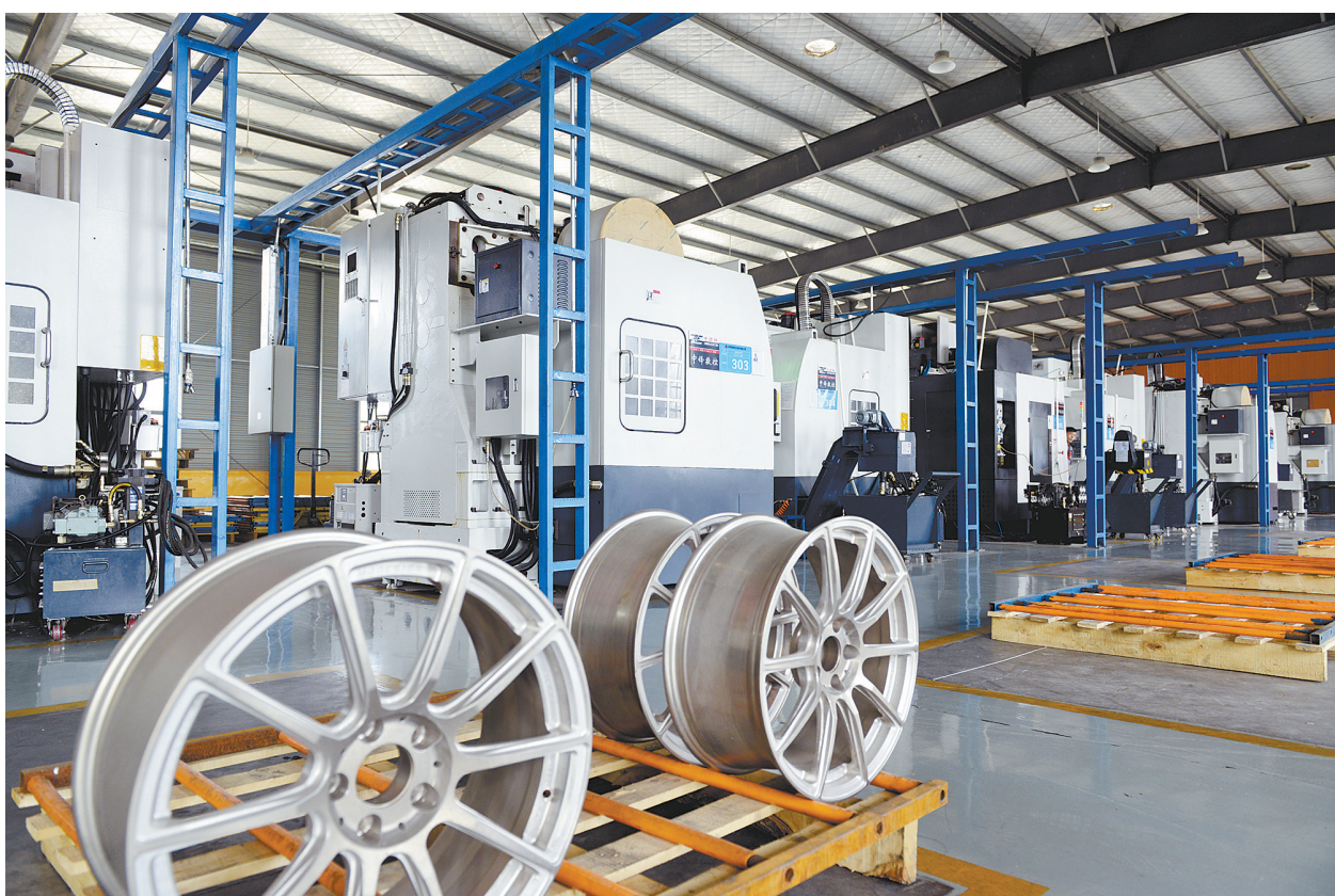
德威科技公司引进德国库克技术和机器人智能自动化生产线，生产出的轮毂具有质量轻、强度高、阻尼性好、抗疲劳性强等特点。在对德合作中，该公司与德国奔驰设计公司签订了3年总额达5亿元的镁合金轮毂订单，成为奔驰、宝马、保时捷等德系高端汽车的配套供应商。