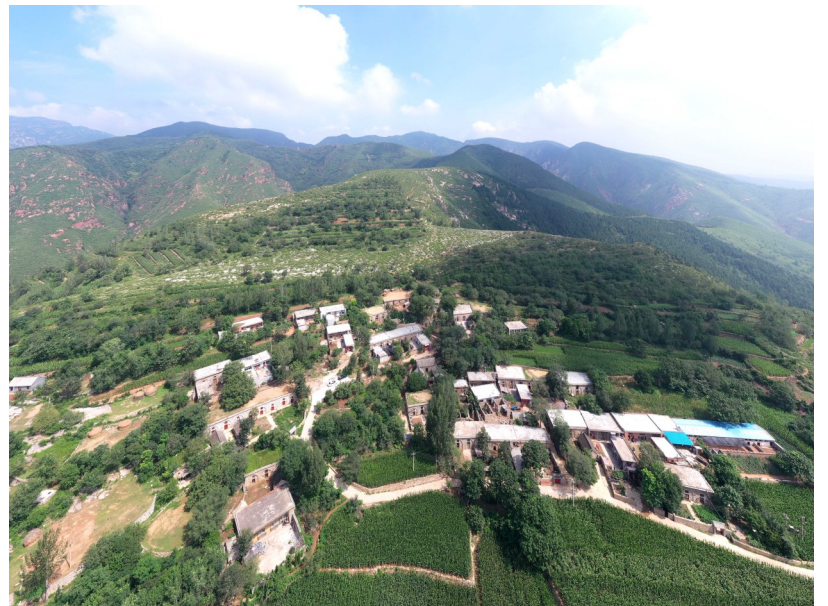
图为8月8日航拍的禹州市鸠山镇魏井村的大牡丹坪自然村。

闻王峡是王书记重点推介的地方，他说，游客来到魏井村，不但要看石头房子、老井和石磨，而且还要看美丽的野外风光。(下转第八版)