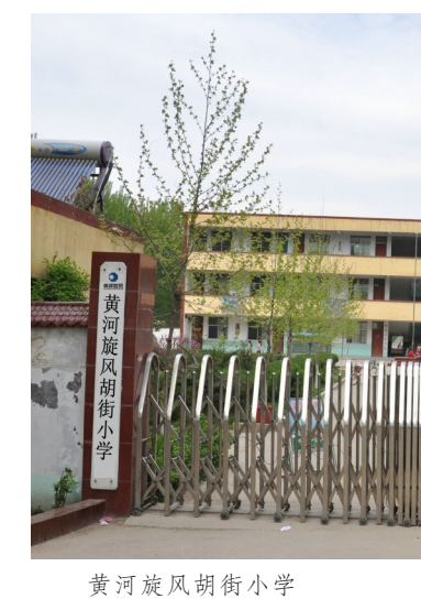
黄河旋风胡街小学 资料图片

据统计,10多年来,黄河集团用于赈灾、支持城建、为农村修路、支持教育事业、慰问送温暖等公益事业的资金有1.68亿多元。