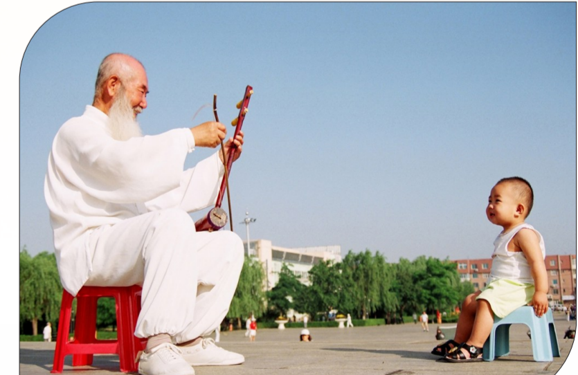
在广场一角休闲的市民