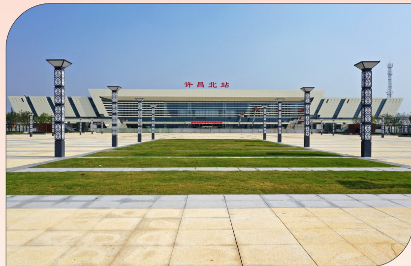
郑合高铁许昌北站

延伸功能。建安区按照建设“宜居之城”的要求,聚焦城市让生活更美好这一目标,加快推进城区学校、商超等配套设施建设,持续完善城市公共服务,切实完成新城区打造舒适宜居、功能完善的发展高地,不断提升城市品质。