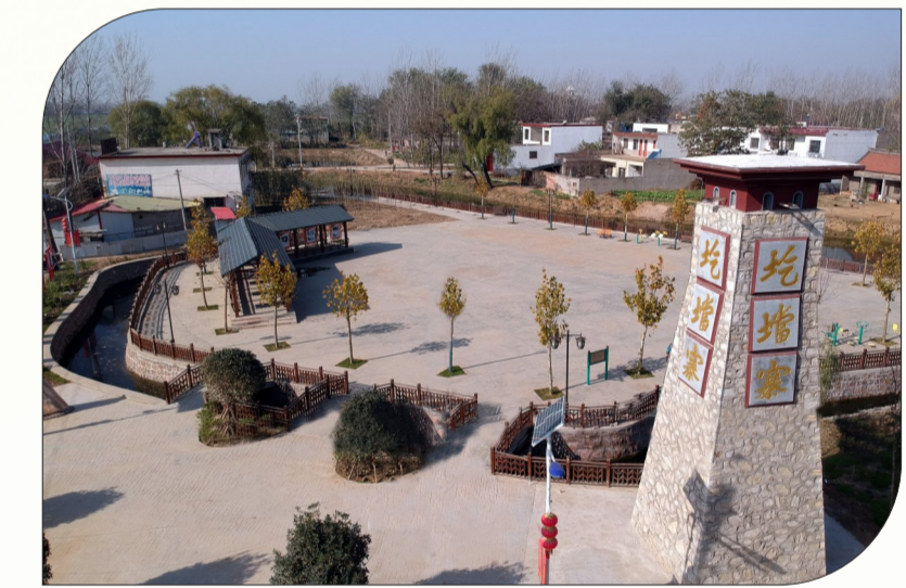
全备水美乡村——蒋李集镇刘培村