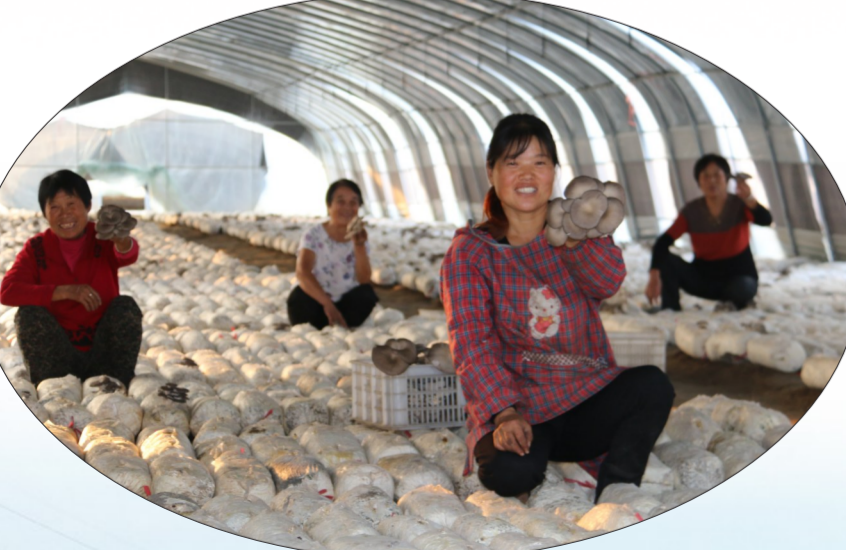
产业扶贫让群众笑开颜