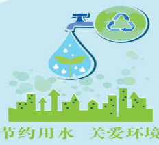
节约用水 关爱环境