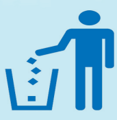
您的好习惯,我们的好环境