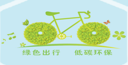
绿色出行 低碳环保