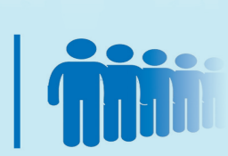
自觉排队 文明出行