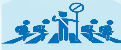
遵守交规,善待生命!