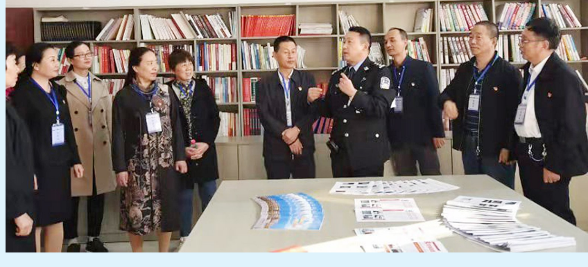
←10月18日,许昌市中心医院组织党员干部到许昌市看守所开展警示教育活动,增强党员干部廉洁自律意识,筑牢拒腐防变思想防线。