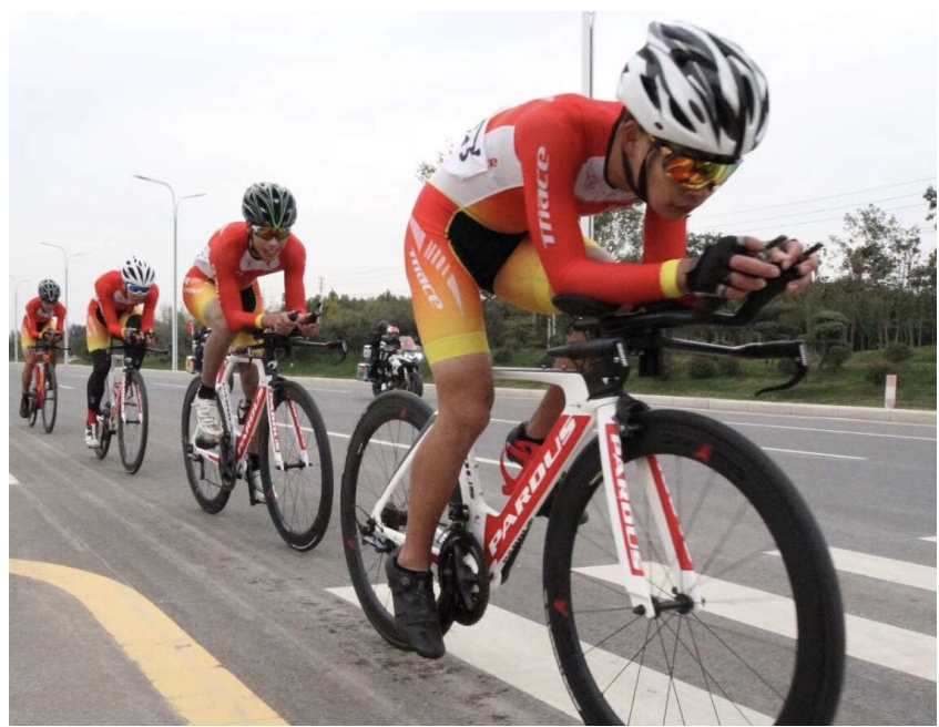
10月25日,由许昌市体育运动学校协办的2019年“体彩杯”河南省公路自行车锦标赛在郟陵开赛。本次比赛由河南省体育局主办,河南省自行车现代五项运动管理中心承办,许昌市体育局协办,来自全省各地的11支代表队共计210余名运动员参加,我市17名选手参赛。

长葛市产业集聚区2018年规模以上工业总产值完成1070亿元,同比增长13%;完成固定资产投资82亿元,同比增长5%;完成税收13亿元,从业人员9.5万人。大周再生金属循环产业集聚区2018年实现工业总产值635.8亿元,增长37.1%;上缴税金15亿元,增长45.6%;完成固定资产投资42亿元,较上年同期增长98.5%,招商引资33亿元,较上年增长1.9%。特别是中欧(德)再生金属生态城建设进展顺利,金汇·晟丰科技有限公司年产80万吨精密不锈钢连轧项目生产正常,德威科技股份有限公司年产100万只铝镁合金汽车轮毂项目第一条生产线正常运营,先后通过国内、美国、欧盟数据检测,获北美、欧盟镁合金汽车轮毂产品准入资格。