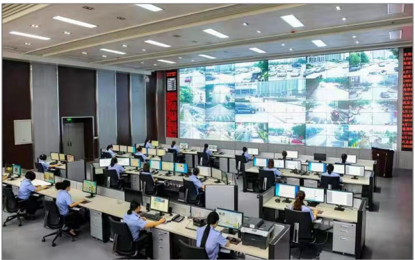
高效运行的禹州市治安防控综合指挥中心,着力提升应急处突能力和公共服务水平

2017年,该市被评为“河南省平安建设优秀县(市)”,2016年、2018年,被评为“许昌市平安建设优秀县(市)”。