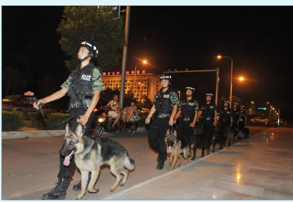
夜间治安巡逻常态化,提升群众安全感