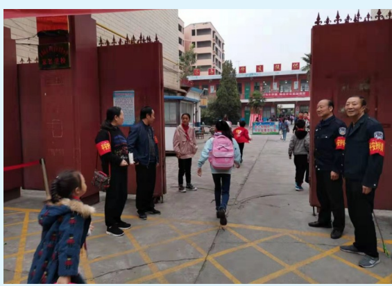
坚守“平安护学岗”,打造平安上学路