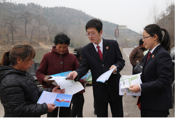
检察官走村串户开展法治宣传