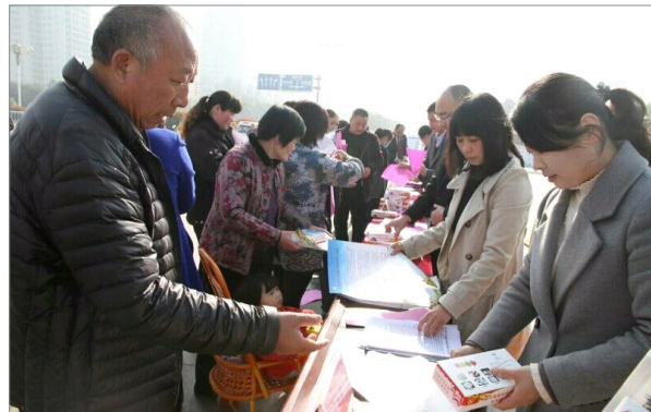
平安建设连万家,人人参与人人抓