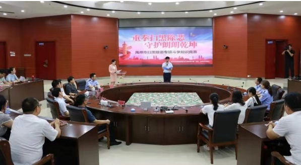
举办扫黑除恶专项斗争知识竞赛,提高干部群众参与度