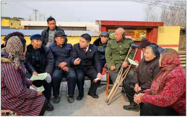
法官深入群众宣传扫黑除恶专项斗争