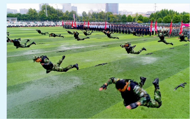
砺剑铸精兵,全力保平安

刚刚闭幕的中央十九届四中全会对推进治理体系和治理能力现代化提出新要求。站在新的历史方位,禹州市将牢牢把握以人民为中心的发展思想,切实履行好维护国家政治安全、确保社会大局稳定、促进社会公平正义、保障人民安居乐业的职责任务,为禹州市在中原更加出彩中走在全省和许昌市前列提供坚强的政法保障。