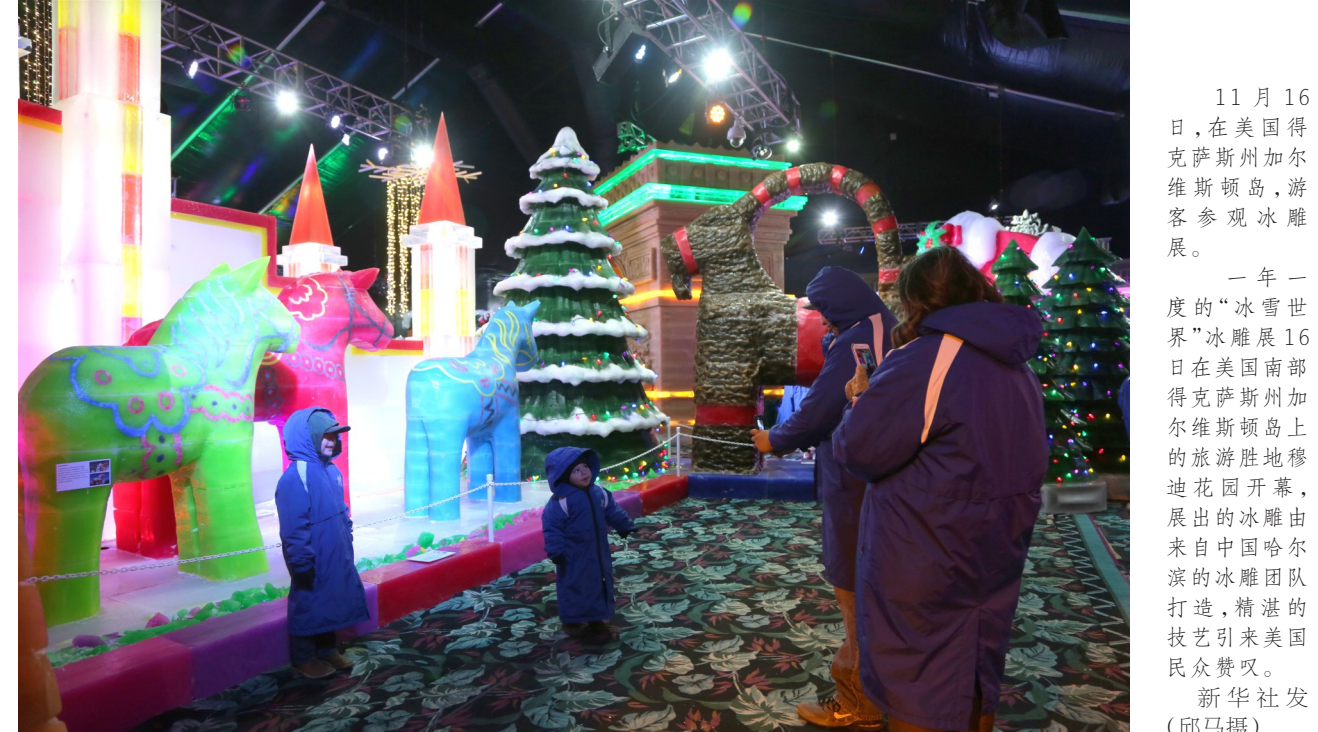
11月16日,在美国得克萨斯州加尔维斯顿岛,游客参观冰雕展。一年一度的“冰雪世界”冰雕展16日在美国南部得克萨斯州加尔维斯顿岛上的旅游胜地穆迪花园开幕,展出的冰雕由来自美国哈尔滨的冰雕团队打造,精湛的技艺引来美国民众赞叹。