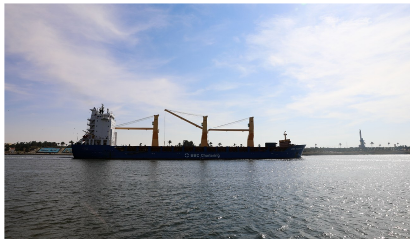
11月17日,在埃及伊斯梅利亚,一艘货轮从苏伊士运河上驶过。埃及苏伊士运河管理局17日在埃及东北部伊斯梅利亚省举行仪式,庆祝苏伊士运河通航150周年。

纷争消散,苏伊士运河凭借其地理位置和运输条件持续发挥强大枢纽作用。苏伊士运河收入与旅游业、石油和