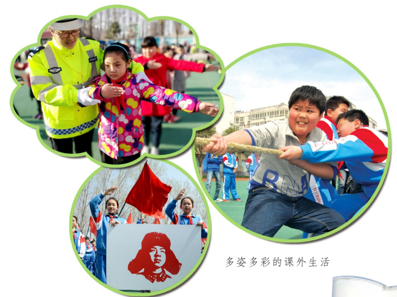
多姿多彩的课外生活

仅用短短三年，“一外”便实现满员。到了近年，每年的招生季，“一座难求”已成了常态。随着生源的增多，“一外”的校园也在悄然发生着变化，如今的“一外”，树木葱茏、芳草萋萋，亭廊生辉、设施完备，处处充满了勃勃生机。该校先后多次被命名为“河南省民办教育先进单位”“河南省民办教育质量特色创建先进单位”“河南省民办教育名片学校”“许昌市民办教育先进单位”“许昌市管理规范化学校”“许昌市素质教育示范校”“许昌市绿化先进单位”“许昌市园林单位”等，并受到省教育厅的奖励。老骥伏枥的白中兴校长也被评为“河南省民办中小学名校长”“河南省民办教育领军人物”。