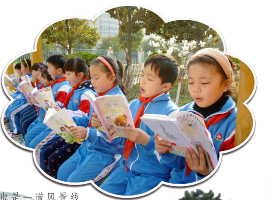
集体朗读也是一道风景线