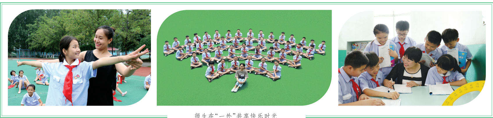
师生在“一外”共享快乐时光