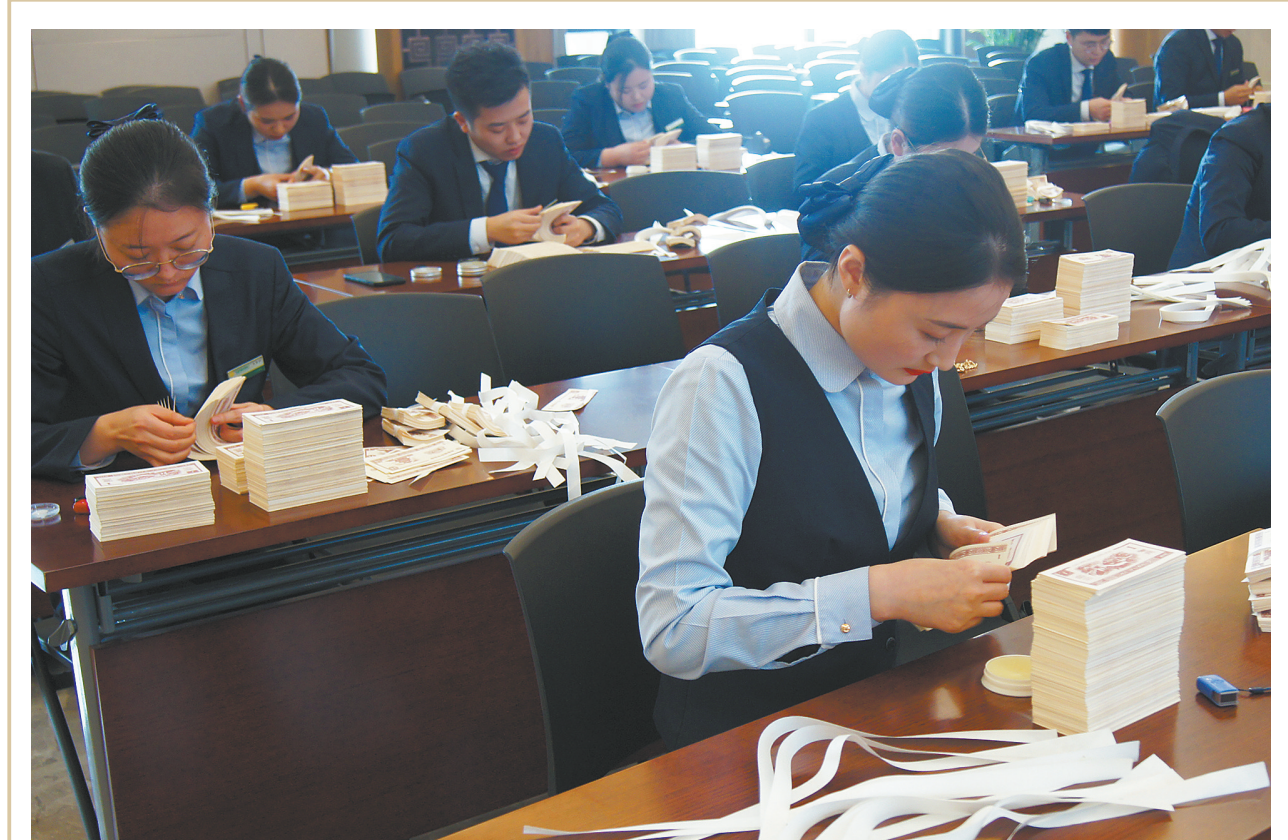
为提升员工的业务素质,11月20日,长葛市审计局举行了2019年下半年业务技能比赛。该比赛共设单指单张点钞、花式点钞、百张录入3个项目,共有150余名员工参加了比赛。图为比赛现场。