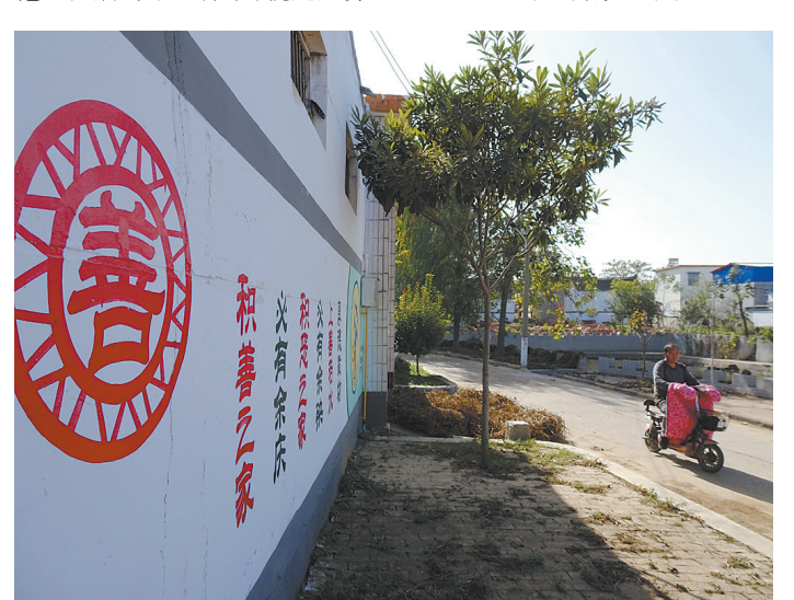
营庄村的大街小巷中,到处都有精美的墙体彩绘。