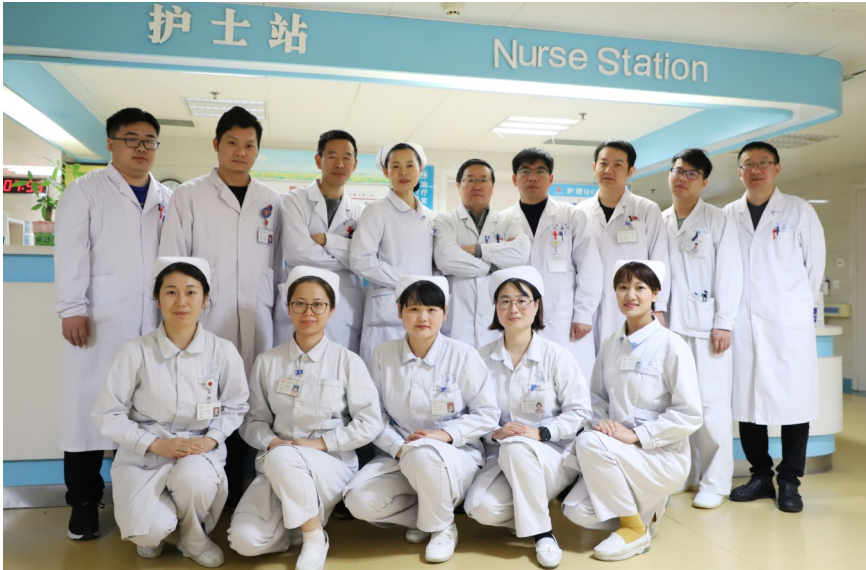
务实奋进的医护团队

这样的例子在许昌市中心医院泌尿外科不胜枚举。为了让患者不出许昌就能享受到省内乃至国内优质的诊疗服务,近年来,该科在技术创新的道路上从未止步,采用了一系列高水平的微创技术,已经成立泌尿系统结石