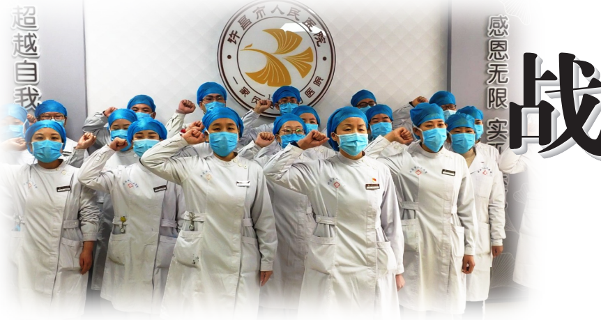
超越自我 感恩无限