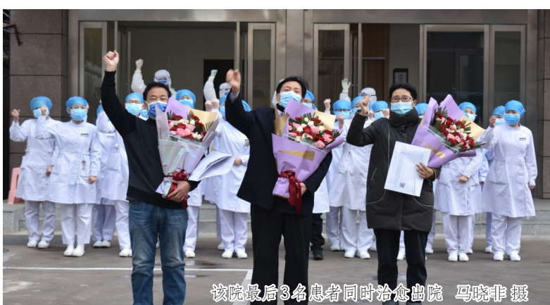
该院最后3名患者同时治愈出院