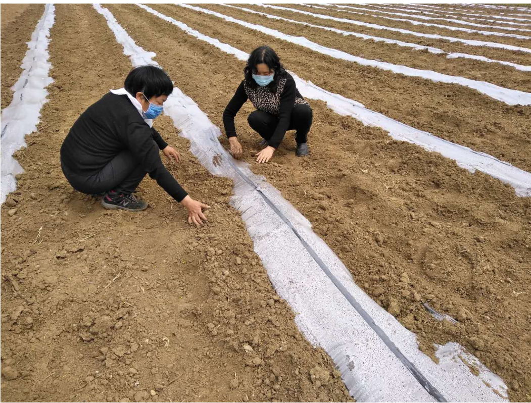
4月3日，建安区椹河乡孙庄村农民正在观察瓜苗生长情况。为积极推进春季农业生产，建安区利用多种手段，指导农民落实关键措施，发挥基层农技推广站作用，组织农技人员开展技术指导，确保全区春耕春播有序开展。

4月3日上午，在市区八一路西段，记者看到杨树已经开始飘落飞絮。一辆洒水车正在附近进行洒水作业，防止落地的飞絮飘到空中。 记者沿路观察了一下，发现不少杨树虽然产生了杨絮，但量并不大。“已经飘几天啦！今年防治的效果不错，比往年明显少了许多。”提起这里的飞絮，一名环卫工人说，每年这个时候最让她头疼的就是这些飞絮。 “这些杨树都注射了‘抑花一号’杨柳飞絮抑制剂。这种抑制剂能有效控制飞絮的产生。”市园林绿化管理处负责人介绍，八一路西段栽种的杨树属于毛白杨，枝干挺拔粗壮，生态效益好，不易生病，吸收污染气体、防治微生物的效果好，但缺点是春天会产生飞絮。 据了解，飞絮是植物生长扬花期的一种生理现象，是植物生长发育过程中的一种自然现象。目前，我市产生飞絮的树木有毛白杨、柳树和速生杨，一般在3月下旬到5月上旬出现。此外，飞絮的多少与温度密切相关，早上和晚上温度较低，飞絮较少，而中午和午后温度较高，飞絮也会多起来，可持续一个多月时间。 从2014年起，我市有关部门对市区的14600株杨树和柳树进行了注药防治治理，并有针对性地调整了树种结构，以避免飞絮污染环境、给市民的生活带来影响。到2019年春天，市区的飞絮量整体减少80%至85%。 在注药防治方面，我市通过当年注射药物，可以控制次年的飞絮。等到飞絮结束之后，园林绿化人员将继续对杨树和柳树注射飞絮抑制剂。在调整树种方面，我市通过控制增量、减少存量、局部综合整治，让市区的不少杨树、柳树置换出去，减少了每年的杨柳飞絮。 除此之外，在今年春季飞絮高发期，我市相关部门使用无人机、雾炮车等工具对杨树、柳树喷洒抑絮剂，每三天冲洗一次树冠，增加日常保洁频次，及时清除地面及空中的飞絮。 市园林绿化管理处负责人表示，下一步，他们将进一步优化树种，强化源头防控。对新建的市政道路、公园绿地，严禁使用雌株杨树、柳树，优先选用国槐、白蜡、榉树、杜仲等本土树种；开展市区杨树、柳树栽植情况摸底调查，根据树龄、树况及专家意见，制订树木更换计划，依法逐步替换。