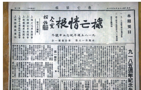
▲记录九一八事变的旧报纸 ▲红色收藏品 ▲老物件