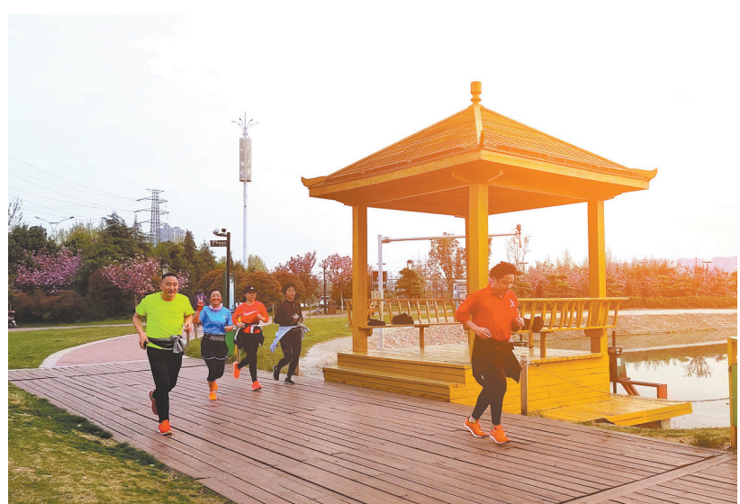
连日来，我市天气持续晴好，各游园、公园繁花似锦、春意盎然，许多市民走出家门或赏景，或运动，享受良好生态带来的福祉，感受春日的美好。图为近日市民在鹿鸣湖畔跑步。