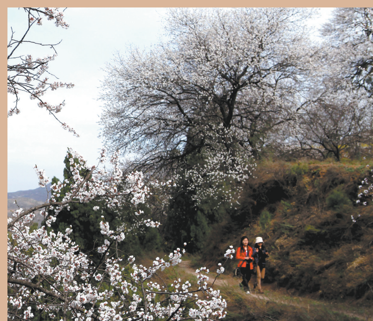
▲春风融融，随着全国疫情防控形势逐步向好，近日，人们纷纷走到户外，亲近自然。图为游客在禹州踏青赏花。