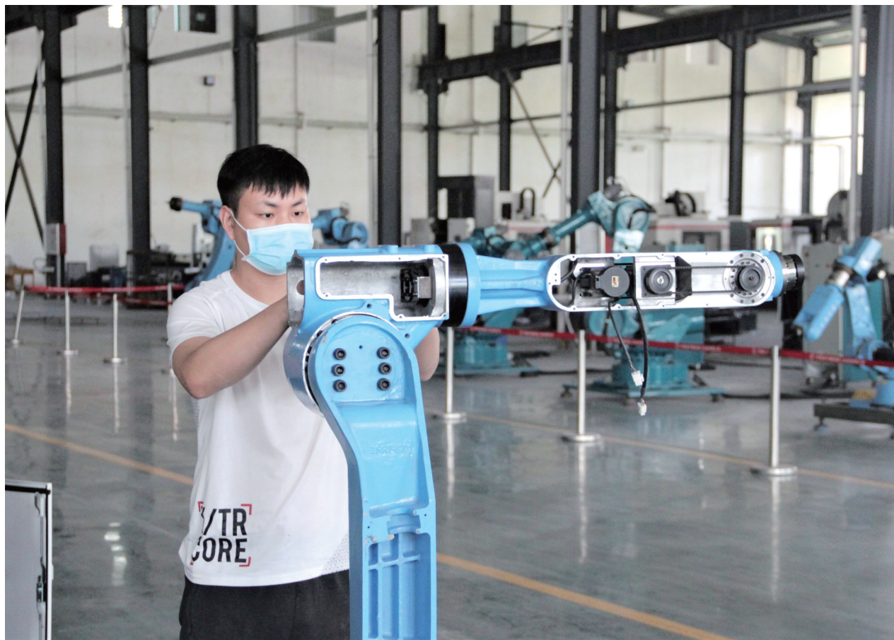
河南睿辰机器人智能科技有限公司致力于机器人专业化研发,与西安交通大学、郑州机械研究所、郑州大学机械研究院等高校和科研院所持续进行合作,开发研制多用途工业机器人及康复机器人产品。图为工人在组装一台工业机器人。

据悉,连日来,该公司营销人员先后对6家扶贫企业进行走访,已与3家企业签订“电能替代”协议;预计每年能够助力扶贫企业减降用电成本6万余元,有力促进了扶贫企业的发展。