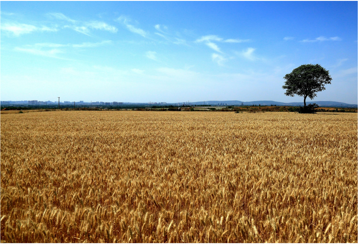
金色粮仓

个融合的平台。在这里，我赏月光，看星辰浩瀚，也听小虫子奏响自然的交响曲，呼吸的都是最新鲜的空气，感受四季更迭。梁思成曾说：“对于