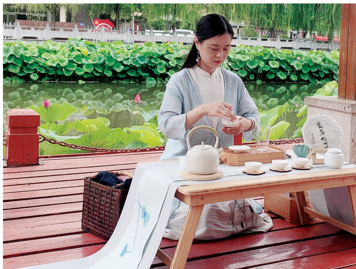
“接天莲叶无穷碧,映日荷花别样红。”进入6月中旬,市区河湖水系内的荷花竞相开放,吸引了许多市民移步河畔赏荷消暑,享受市委、市政府兴水植荷带来的福祉。图为市民在河畔品茶、赏荷。

示,自己健身目的也是为了减肥,但她惊喜的是经过一段时间的锻炼后,自己感冒的次数变少了,体质变好了,皮肤也紧致了许多。