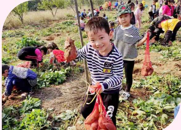
劳动教育 生动有趣