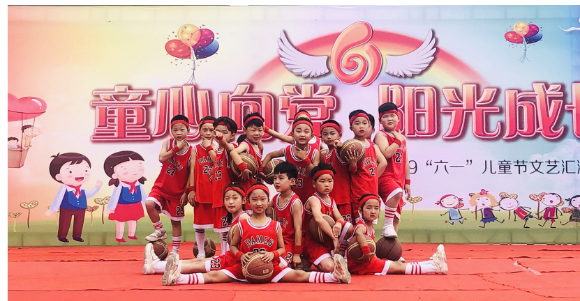
多彩活动 快乐成长

此外,该校通过班级微信群、钉钉平台、报纸等,充分利用家校合作的桥梁,倡导学生“帮班级做一件事情,帮家长做一件家务”,自觉树立学生自理自立、分工合作的自主意识。该校组织学生“走进大自然,走入生活中”,通过“挖红薯技能比拼”“趣味毛毛虫赛跑”“射击训练”“滑索体验”等环节让实践活动变成积累知识、掌握技能、丰富自我、磨炼意志、培养良好习惯的舞台,实现课程与实践相结合、知识与能力相结合、育人育智相结合,进一步创新教育模式,做出成绩、做成样板,切实走出一条特色鲜明、成效显著的教育发展道路,为今后学生修身、立德、服务社会打下坚实的基础。