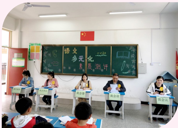
多元测评 激发潜能