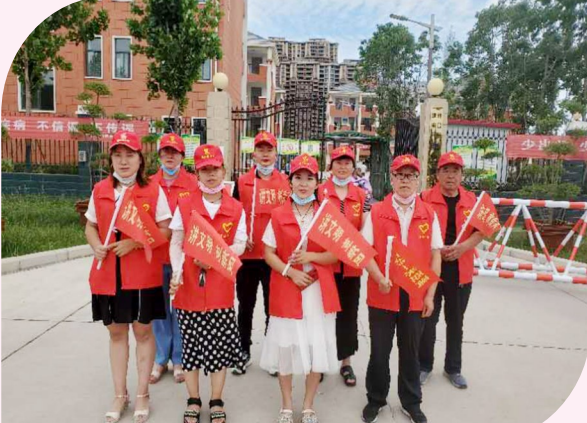
志愿服务 彰显大爱