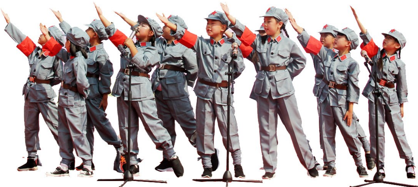
朗诵比赛 歌颂祖国

尽管学校还很年轻,但是领导班子成员勇立潮头,高举旗帜,以身作则,踏浪前行,要求教师们做到的,党员教师率先做好,领导班子当好榜样;要求教师们不能做的,党员教师要严格遵守,领导班子做好模范,以此丰富党内政治文化,凝聚发展合力,为各项工作健康开展打牢了思想基础,从而不断增强学校党支部的凝聚力、创造力、战斗力,推动学校教育和谐稳步发展,为办好人民满意学校提供坚强的组织保障。