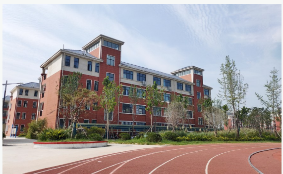
校园环境 优美宜人

在建安区这片热土上,有一颗冉冉升起的教育新星——建安区魏风路小学。这所历史不长的学校勇立潮头、为民办学,秉承为学生和教师的终身发展奠基铺路的办学理念,以其独具特色的育人体系迅速崛起,成了一片放飞理想的沃土。虽然办学不到两年,但是这所浸润人文精神的学校用爱心和责任成就未来,智慧和勤奋托起希望,已成为人们眼中“家门口的好学校”。