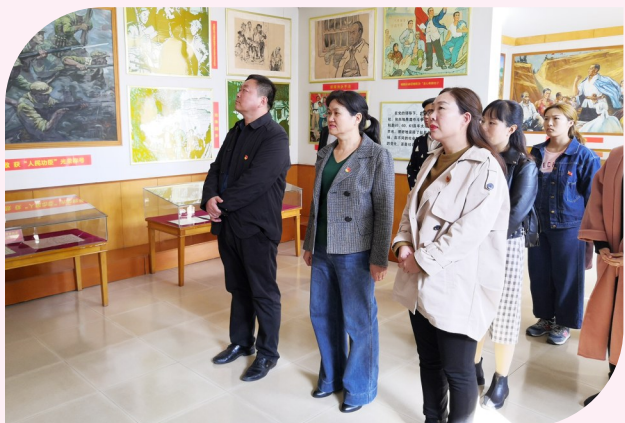
党建引领 不忘初心

管理有方、教学有才、处事有方,凭借这样扎实的工作作风,建安区魏风路小学这颗教育“新星”正在冉冉升起,渐渐赢得人们信任和期许的目光;相信通过不懈的努力,这颗“新星”终将成为人们心中的教育“明星”,在世人的瞩目下闪烁光芒,用人文精神为万千学子浸润人生“底色”。