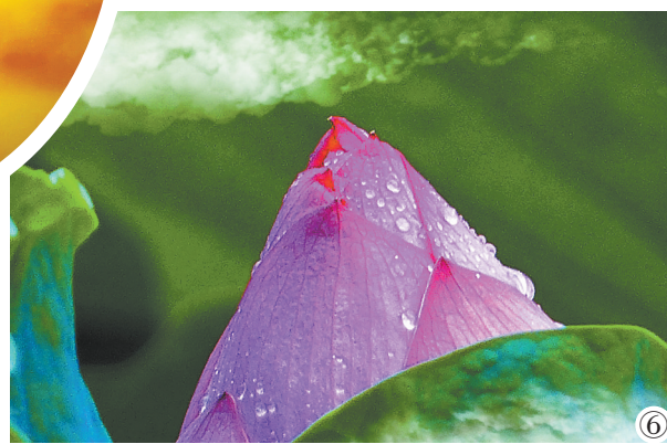
①北方水乡 ②家园 ③护城河之态 ④如诗如画 ⑤梦荷 ⑥鸟语