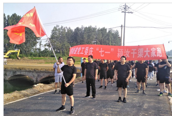
▲6月30日早晨,魏都区颍昌街道党工委组织机关党员干部在颍汝干渠综合整治现场举办庆“七一”大家跑活动,激发党员干部投身“智造之都 宜居之城”建设的积极性。