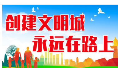
本报讯(记者胡晨 通讯员高尚 梦培)7月1日,中央公园接管仪式举行。

式举行,市城管局全面接管中央公园统一管养工作,标志着中央公园管理工作进入一个崭新阶段。