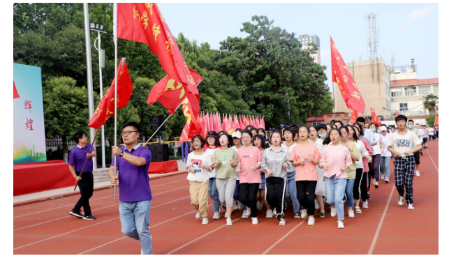
许昌高中高三学生激情跑操。

本报讯(记者松召峰 通讯员付恒伟)7月2日,许昌高中举行了2020年高考出征动员誓师大会。该校领导和全体高三教师为即将步入高考考场的高三学子壮行。