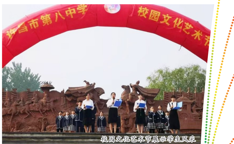
校园文化艺术节展示学生风采