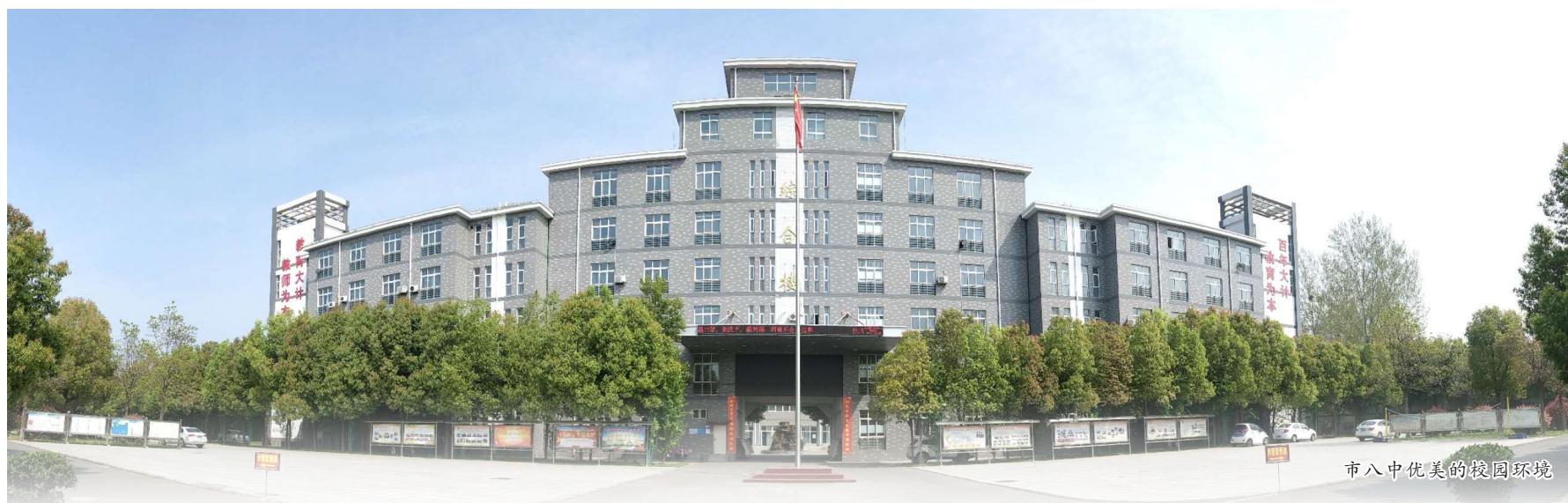
市中八中优美的校园环境

细心的许昌市民路过三国名胜灞陵桥景区时会发现,从2018年开始,对面原许昌工商管理学校的门牌被金色的“许昌市第八中学”几个大字所取代。这意味着,曾位于市区人民路的许昌八中开始在城西扎根,开启浓墨重彩的发展新篇!