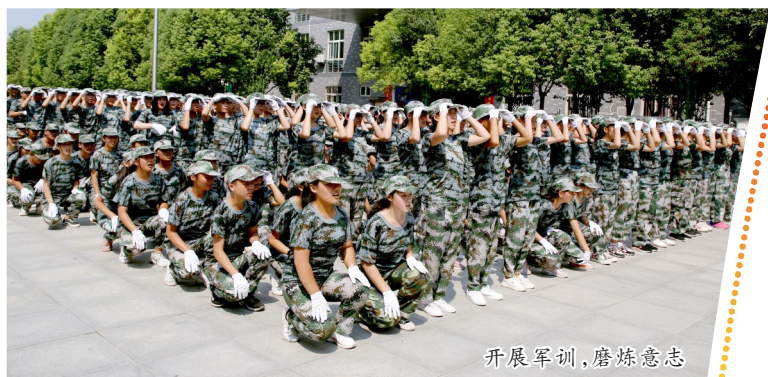
开展军训,磨炼意志

砥砺前行秉初心,特色育人惠芳华。如今的许昌八中占地面积70余亩,校园环境优美,管理扎实,校风纯正,秉承“办好普通高中,发展特色教育”的办学思路,努力“让艺术之花开满校园,为特长学生铺就成才之路”,在不断超越自我中,续写着时代发展的新篇章。