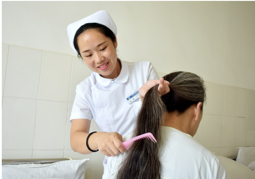
除了发药、观察病情外,该院护士还要照顾患者的生活起居