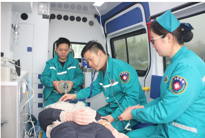
该院开展急性心肌梗死抢救演练

胸痛中心是通过心内科、胸心外科、急诊科、介入科、影像科、检验科等多个学科合作,为急性心肌梗死、主动脉夹层、肺动脉栓塞等急性胸痛患者