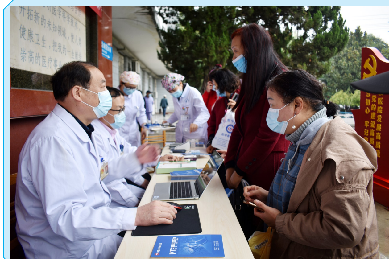
10月13日是第七个“世界血栓日”,今年的主题为“阻击血栓,让生命流动”。当日,许昌市中心医院介入血管科在该院门诊楼前开展义诊宣传活动,让群众更好地认识血栓性疾病的危害,向群众普及血栓性疾病的防治知识。图为活动现场。

老吾老以及人之老,敬老、尊老是中华民族的传统美德。深怀敬老之心,倾注爱老之情,笃行为老之事,河南龙耀健康管理服务有限公司积极推进“医养结合”养老模式,让老年人的生活更加有尊严、有温情、有品质,全力托起老年人幸福的晚年生活。