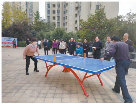
左图:万象春天业主在下象棋 右图:万象春天业主在打乒乓球

“九月九重阳到,运动会真热闹。物业业主一家亲,关爱老人最开心!”这是万象春天的业主写给万象物业的赠语。10月25日,万象物业组织了老年人秋季运动会,希望老人都有一个健康的好身体。据了解,运动会设置了骑慢车、象棋、乒乓球、定点投篮等项目,老人们积极参与,获胜者还可得到万象物业准备的重阳大礼包。