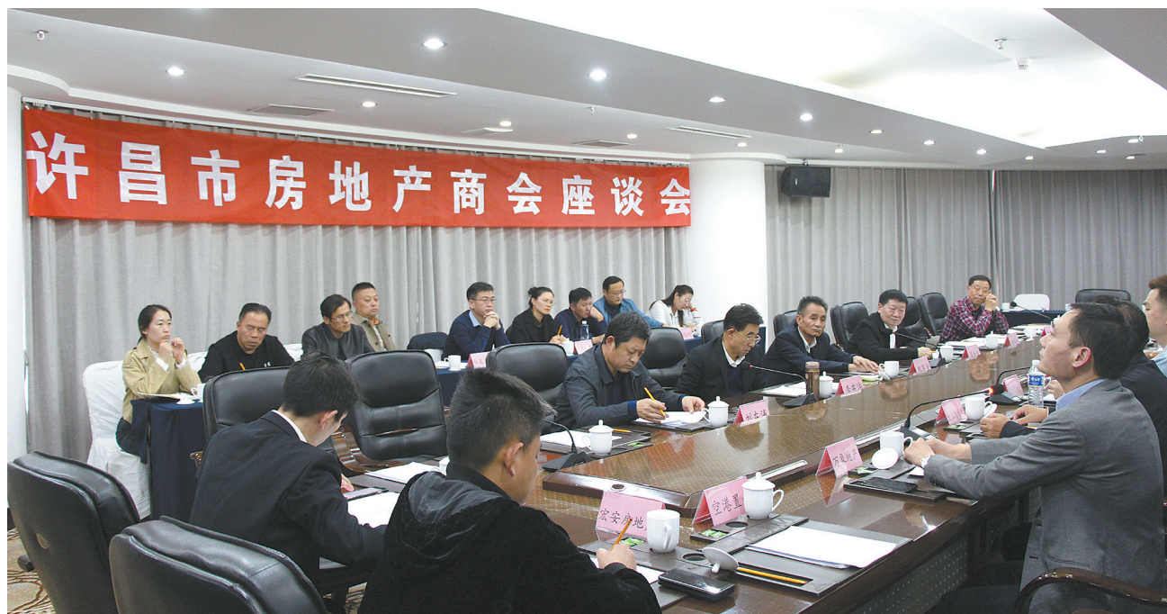
许昌市房地产商会座谈会现场

服困难,房地产行业仍大有可为。房地产行业的发展有自己的特点,呈波浪形发展。在疫情防控的形势下,他提醒房地产企业要稳健经营,不要冒进、盲目扩大,首要目标是活下去。