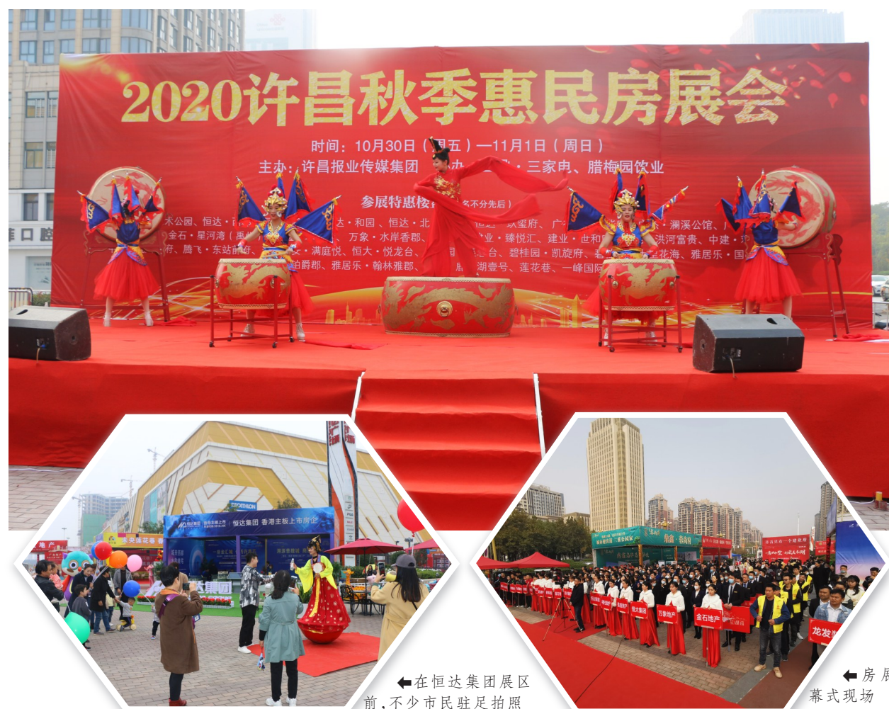
房展会开幕式现场