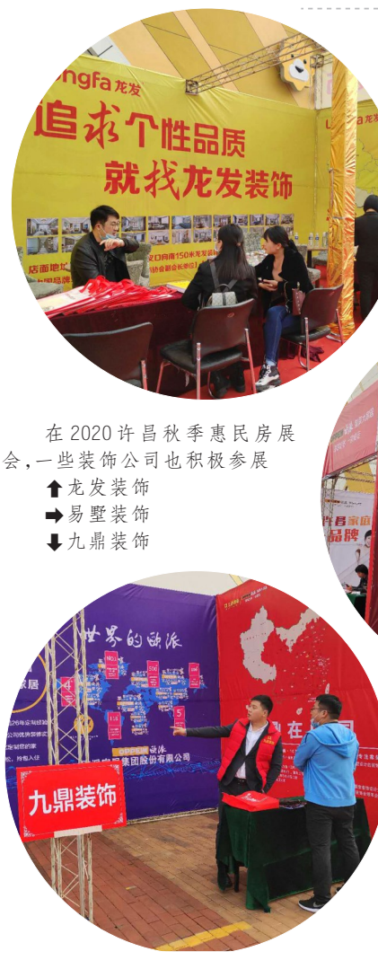
在2020许昌秋季惠民房展会,一些装饰公司也积极参与

经过3天的精彩演绎,本届展会圆满落幕。许昌报业传媒集团主办的展会经过多年的积淀,运作规范专业,效益不断提高,无论是企业还是购房者都非常喜欢。