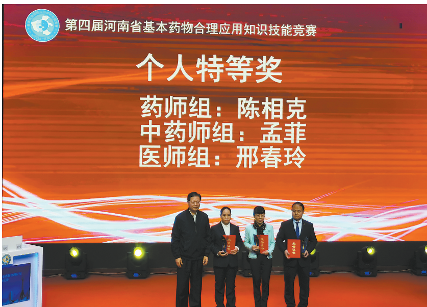
第四届河南省基本药物合理应用知识技能竞赛