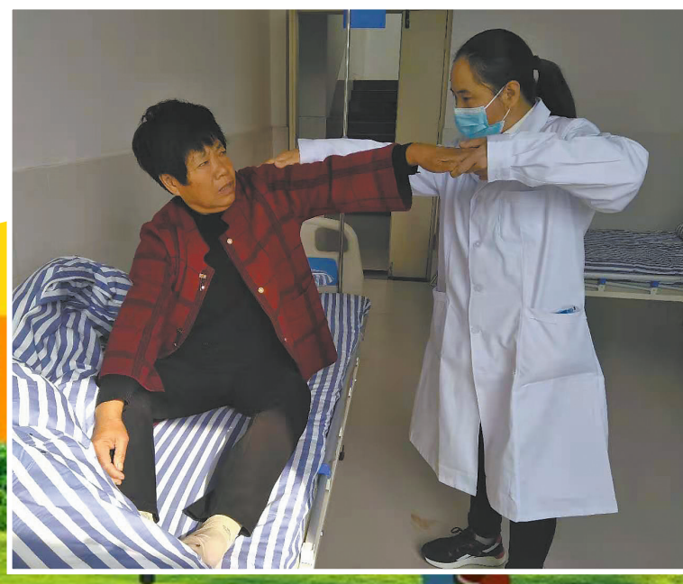
为贫困户患者做康复训练