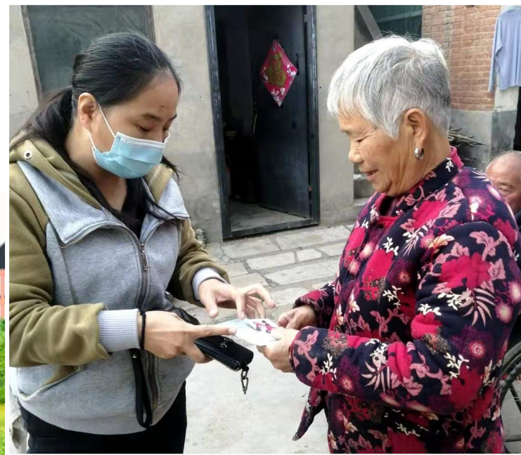
为贫困户患者送药