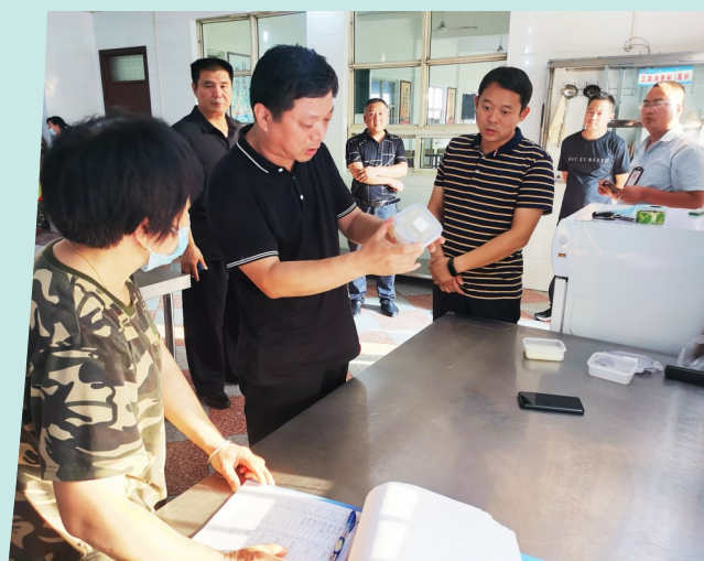
开展养老机构食品安全专项检查