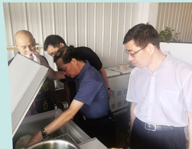
长葛市人大常委会领导调研食品安全工作