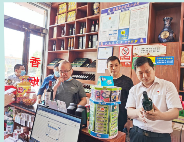
开展食品小经营店专项检查