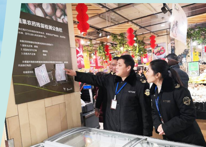
商超日常监督检查