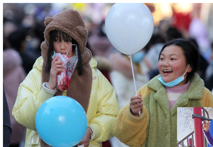
上图：1月1日，在曹魏古城，两位市民手持气球，迎接2021年的到来。