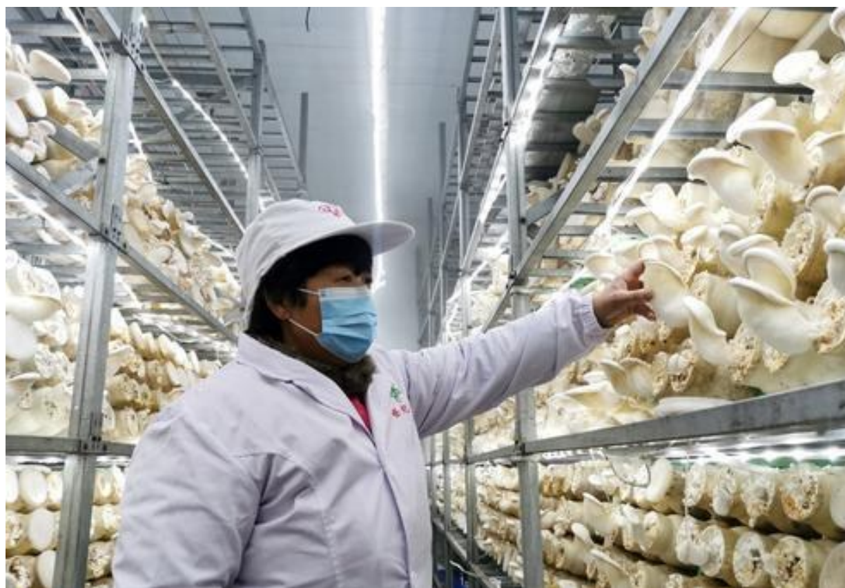
1月25日,位于建安区的世纪香食用菌开发有限公司生产基地,工人正在采收各类菌菇。