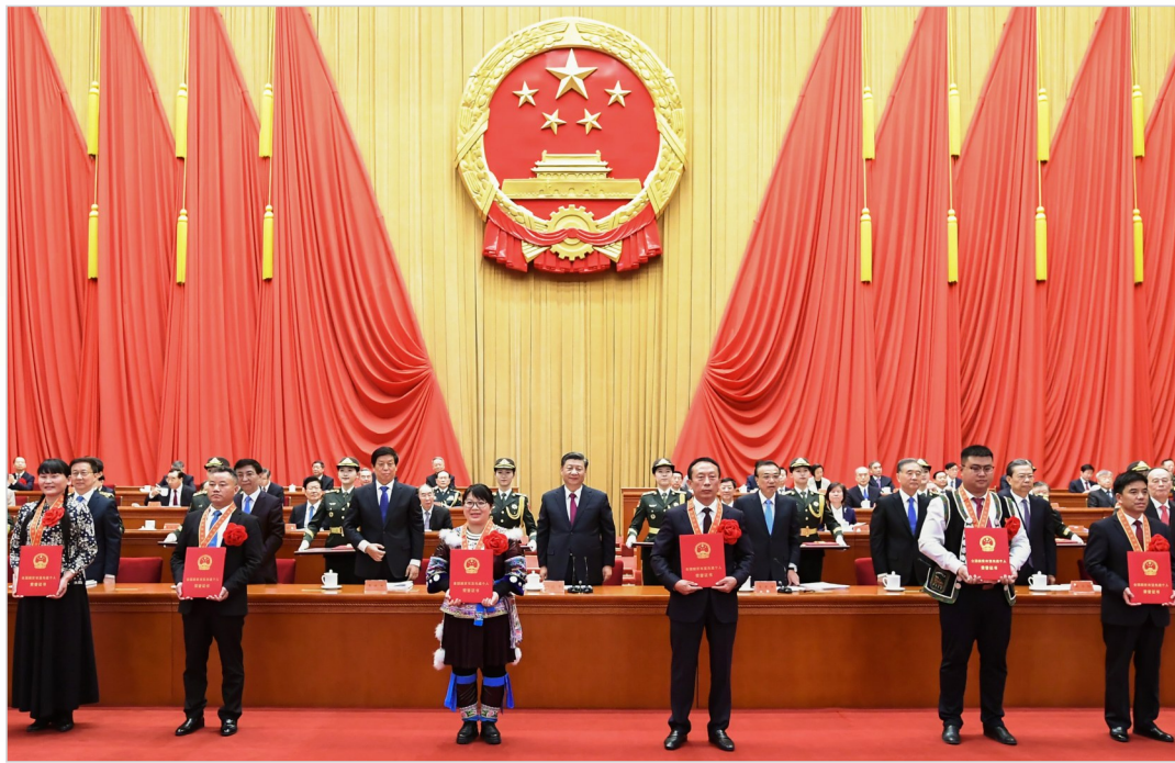
2月25日,全国脱贫攻坚总结表彰大会在北京人民大会堂隆重举行。习近平等为全国脱贫攻坚先进个人和先进集体代表颁奖。