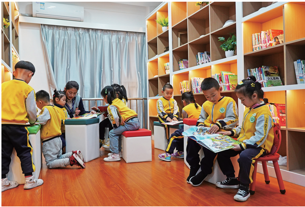
4月1日,幼儿园的孩子们在阅读红色绘本。在国际儿童图书日即将到来之际,江西省南昌市湾里管理局夏泽幼儿园开展“品红色书香,享阅读之趣”主题活动,组织学生走进当地社区邻里中心,诵读红色诗词,阅读红色绘本,讲述红色故事,让孩子们感受红色文化,享受阅读之趣。

这批负压救护车配备了救护担架、氧气瓶、消毒灯、对讲机、车内负压装置等,针对不同医疗机构具体需求,还可以加装除颤仪、呼吸机、便携式心电图机等抢救设备。项目落地后,河南省基本实现了每个县级行政区域配备1辆以上负压救护车,可有效缩短急救出车时间,降低传染病病人转运过程中的传播风险和医患交叉感染风险,提升基层医疗机构应对突发公共卫生事件的能力。