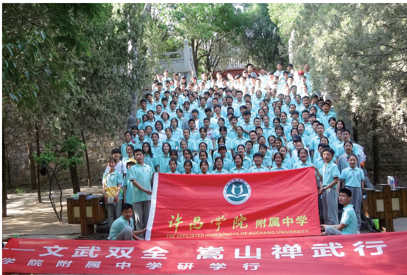
研学活动,寓教于乐

“五成教育”是学院附中大力推进德育工作的缩影,学院附中始终把德育工作贯穿教育教学的各个环节。该校加大常规管理力度,在全校师生中深入开展文明礼仪教育活动;组织开展“文明校园、文明班级”活动,培养学生良好的文明礼仪习惯和行为规范;开展学雷锋志愿服务活动,增强学生的服务意识和责任感,让学生学会做人、会学习、会健体、会审美,让文明之花在学院附中处处盛开。