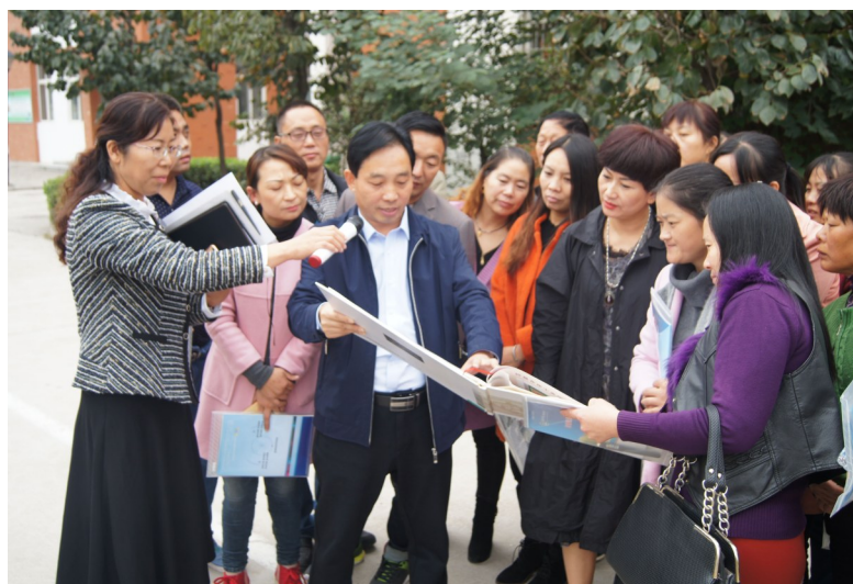
该校领导带领家长委员会委员代表参观学校