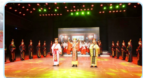
→搭多彩舞台,展艺术风采