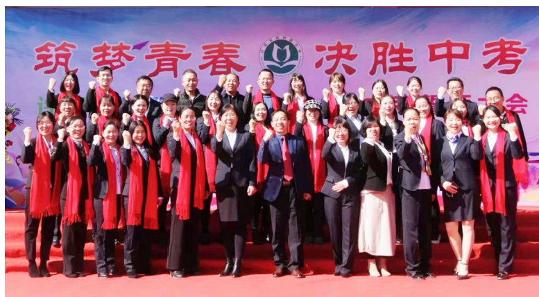
精诚团结,激情洋溢的教师队伍