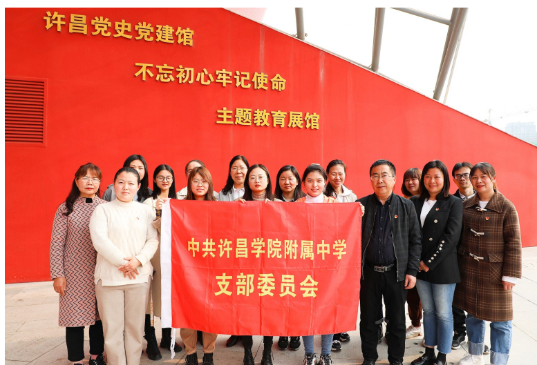
学院附中党支部在许昌党史党建馆开展主题教育活动