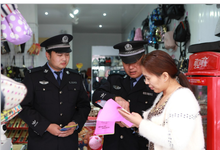
民警走村入户,宣传安全防范知识。