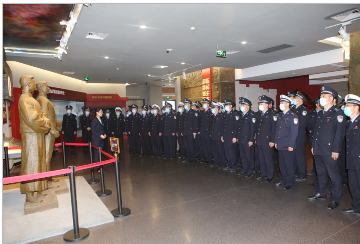
参观红色教育基地,接受革命传统教育。

“人民公安为人民”,鄢陵公安民警正用点点滴滴的付出,护航新时代“花都”鄢陵的发展和进步。