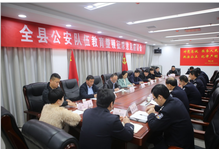
召开座谈会,征求社会各界对公安工作的意见和建议。