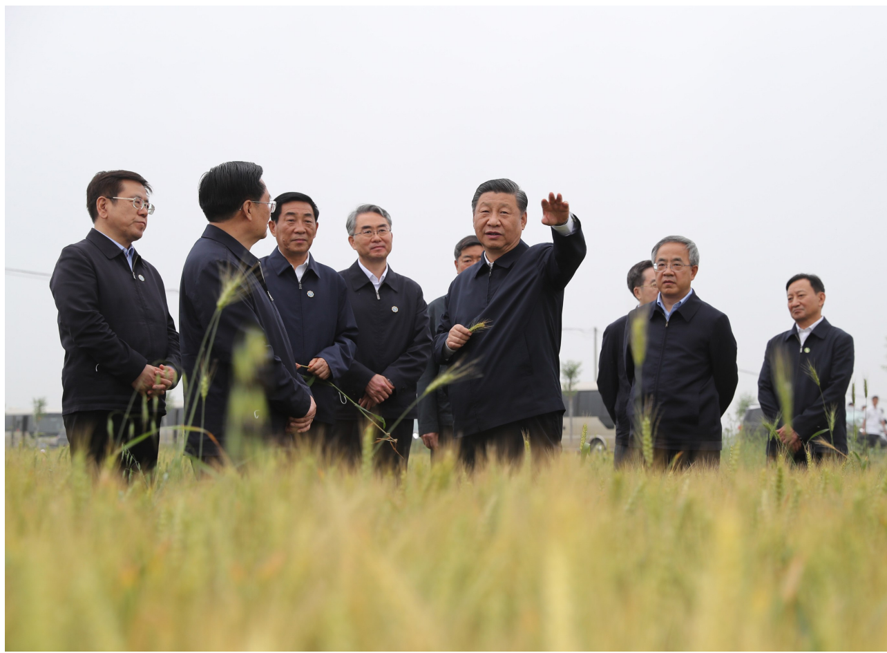
5月14日上午,中共中央总书记、国家主席、中央军委主席习近平在河南省南阳市主持召开推进南水北调后续工程高质量发展座谈会并发表重要讲话。这是座谈会前,习近平于13日在考察途中临时下车,走进一处麦田察看小麦长势。