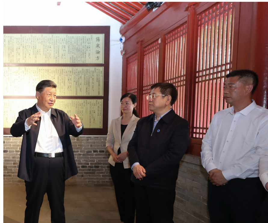
▲ 5月14日上午,中共中央总书记、国家主席、中央军委主席习近平在河南省南阳市主持召开推进南水北调后续工程高质量发展座谈会并发表重要讲话。这是座谈会前,习近平于12日在南阳市考察东汉医学家张仲景的墓祠纪念地医圣祠。