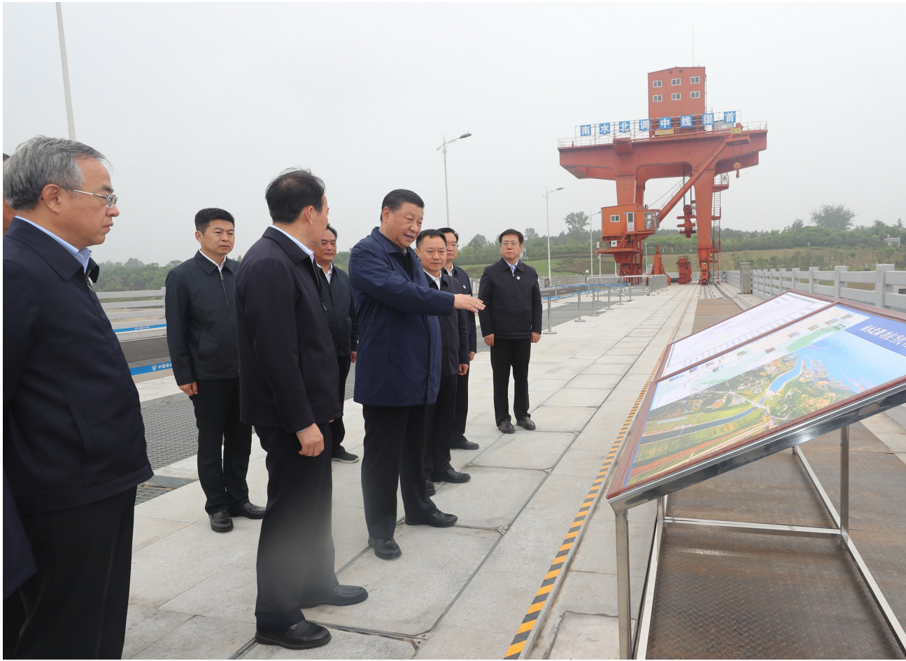
5月14日上午,中共中央总书记、国家主席、中央军委主席习近平在河南省南阳市主持召开推进南水北调后续工程高质量发展座谈会并发表重要讲话。这是座谈会前,习近平于13日在南阳市淅川县陶岔渠首枢纽工程察看引水闸运行情况。