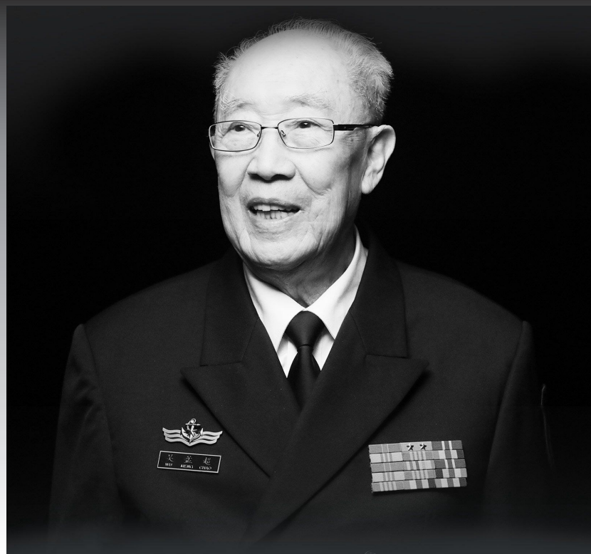
“中国肝胆外科之父”吴孟超