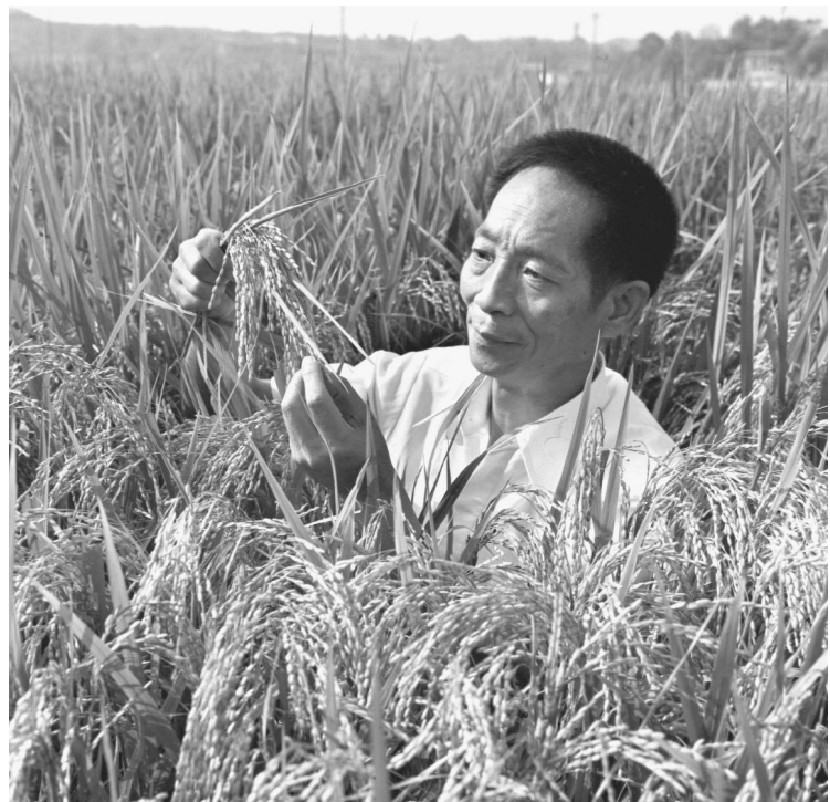
这是1981年，袁隆平为第二届国际杂交水稻育种培训班遴选讲课程的杂交水稻标本。

联合国粮农组织总干事屈冬玉在社交平台上表示，袁隆平把自己的一生献给了杂交水稻研究，帮助数十亿人实现了粮食安全，称袁隆平是自己敬爱的“老师”和榜样，对袁隆平的逝世深感悲痛。