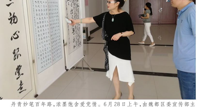
丹青妙笔百年路,浓墨饱含爱党情。6月28日上午,由魏都区委宣传部主办、区文联承办的“翰墨颂祖国 丹青献给党”——庆祝中国共产党成立100周年主题诗词书画展拉开帷幕。本次书画展共征集到诗词书画作品200余幅,集中展出优秀作品80幅,分为诗词书法、美术绘画两个区域进行展览。