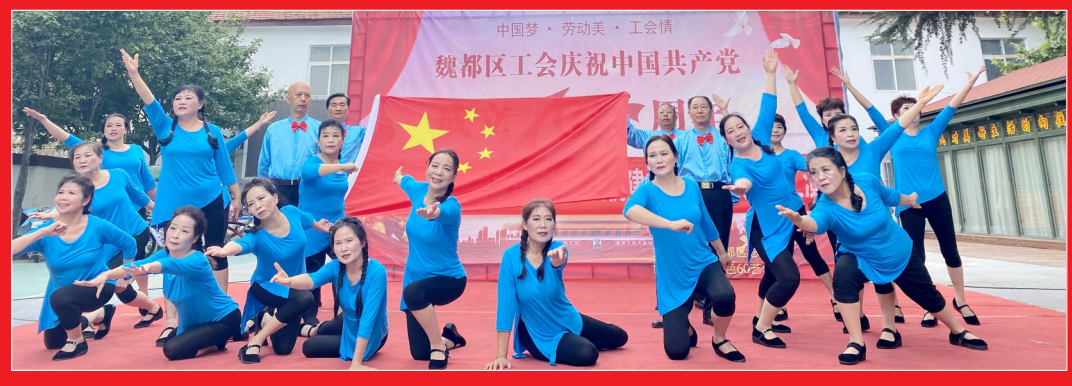
6月27日,魏都区北大街街道办事处杨根思双拥社区联合共建单位,共同举办庆祝中国共产党成立100周年文艺汇演,歌颂在党领导下取得的辉煌成就,更加坚定辖区居民永远跟党走的信心和决心。