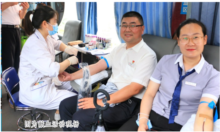
图为献血活动现场

本报讯(记者秦水森 通讯员邱凤生 文/图) 为大力弘扬志愿服务精神,将党史学习教育成果转化为服务群众的实际行动,7月28日上午,腾飞物业党支部组织员工参加腾飞集团无偿献血志愿活动。腾飞物业党支部党员干部带头,42人共献血9000余毫升。