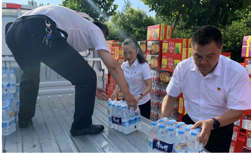
万和物业给马武村村民送来生活物资

暴雨中,万和物业员工坚守防汛一线,并成立应急抢险队帮助老旧小区居民。暴雨过后,万和物业员工纷纷献出爱心,积极参与救灾。