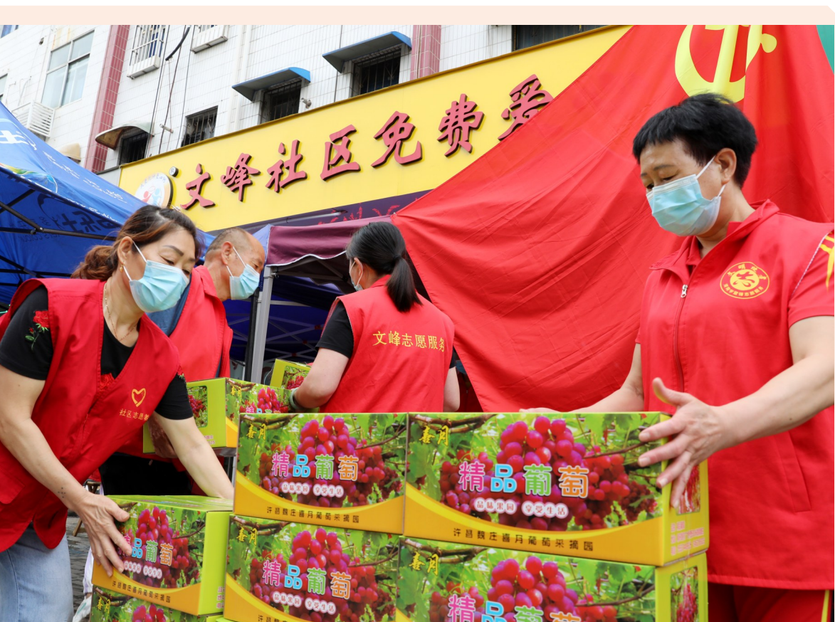
8月11日,魏都区文峰街道办事处文峰社区爱心粥屋的志愿者正在搬运葡萄。当天,许昌三兵律师事务所为该爱心粥屋捐赠100公斤葡萄,通过该爱心粥屋志愿者送给防疫一线的工作人员。