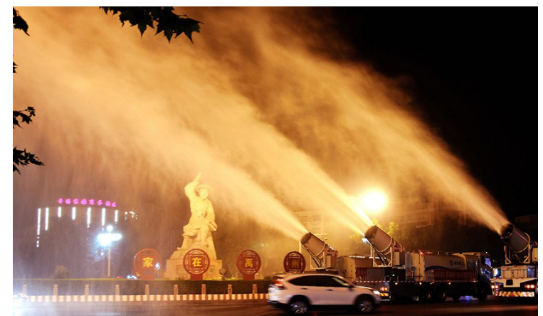
禹州市认真落实防控措施,按照防疫指南要求,加强闭环管理,严防交叉感染。图为8月10日晚,该市对市区主干道进行第3次消杀。