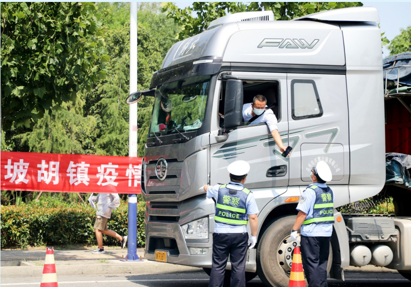
为切实做好疫情防控工作,长葛市公安局交通管理大队、特殊警务大队等警种部门科学安排警力,驻守各疫情防控卡点,加大重点路口管控力度。图为8月6日,该局民警在疫情防控卡点检查过往车辆。