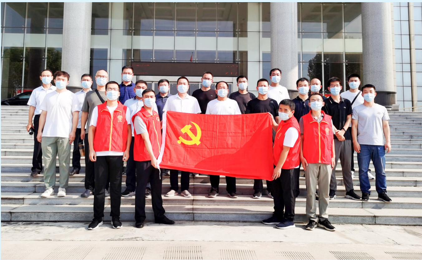
8月8日,建安区人民检察院抽调30名检察干警成立志愿服务队。他们奔赴建安区河街乡6个行政村,帮助开展核酸检测工作,并提醒群众外出戴好口罩,加强自我防护。