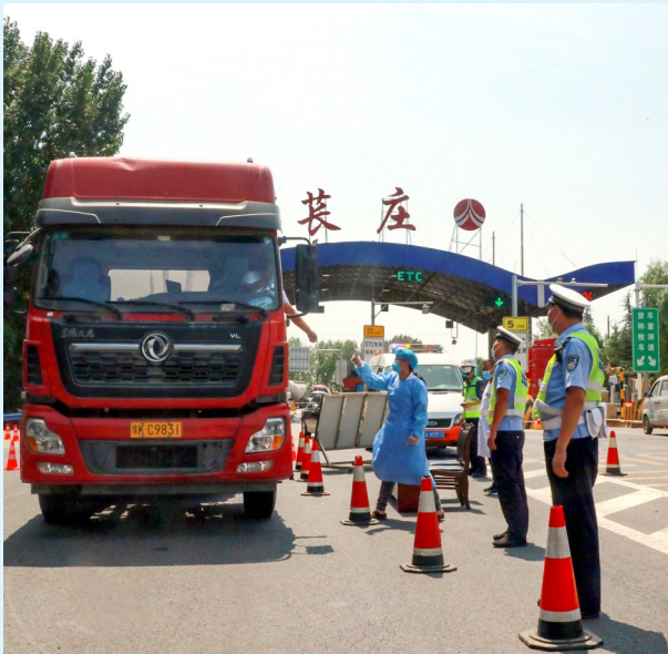
疫情防控工作开展以来,禹州市公安局要求在各检查点值守的民警严格落实疫情查验措施,24小时不间断对入市车辆和人员进行管控。图为8月9日,该局民警在检查点,配合医护人员对过往驾驶人进行检查。