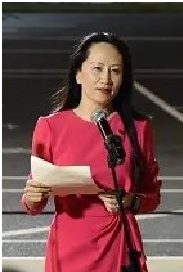
孟晚舟在机场发表简短演讲。