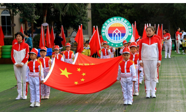
10月28日,许昌市文化街幼儿园平定分园举办了幼儿运动会。本次运动会把爱国种子和运动精神播撒到每个孩子心中,用运动打造属于孩子的快乐天空,让孩子们健康快乐成长。

河南省“最美教师”靳源统作为老教师代表发言。他寄语新教师政治立场坚定,献身教育,学会接受批评、开展自我批评,公平对待每一名学,用专业阅读、专业写作、专业学习助推专业成长,为禹州教育高质量发展贡献力量。