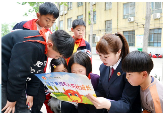
建安区人民检察院开展普法教育活动