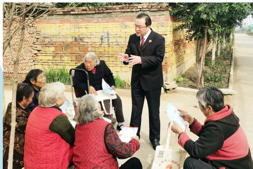
禹州市人民检察院开展送法进乡村活动

搭建平台,学思践悟。该院在网上开辟专栏,及时发布党史知识“周周练”“天天学”等内容,把每周五作为支部学习交流研讨日,每月开展主题党日。读书分享、观看红色电影、诗歌朗诵暨合唱比赛、国旗下的演讲、书法摄影展……一系列活动,令该院检察干警在潜移默化中锤炼坚强党性,使红色基因得到传承,提高了政治判断力、政治领悟力、政治执行力。