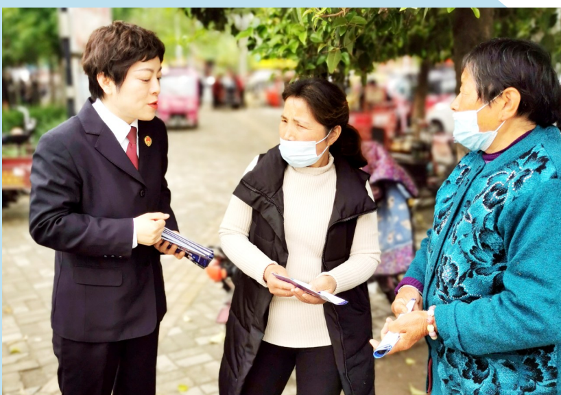
鄢陵县人民检察院开展送法进社区活动

全市检察机关将继续牢记党的宗旨,发扬优良传统,做深做实党史学习教育,真抓实干、担当作为,奋力答好“推动检察工作高质量发展”和“更好服务经济社会高质量发展”的时代答卷,以更加出彩的检察工作,服务保障许昌社会主义现代化建设全面开创新局面。