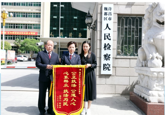
魏都区人民检察院依法履职护航发展赢企业满意