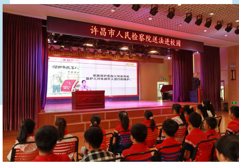
许昌市人民检察院开展送法进校园活动

9月17日上午,全市检察机关中秋国庆节前集体廉政谈话暨警示教育大会召开。市人民检察院党组书记、代检察长赵艺林给全市检察干警上廉政党课。