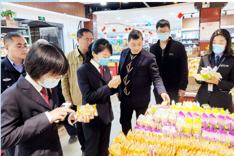
长葛市人民检察院开展“保障农村食品安全”公益诉讼专项监督活动

一桩桩、一件件为民实事,彰显着该院干警“身入”基层、“心系”群众,精准解决群众所忧所急所盼,当好群众的知心人、贴心人的赤子情怀。