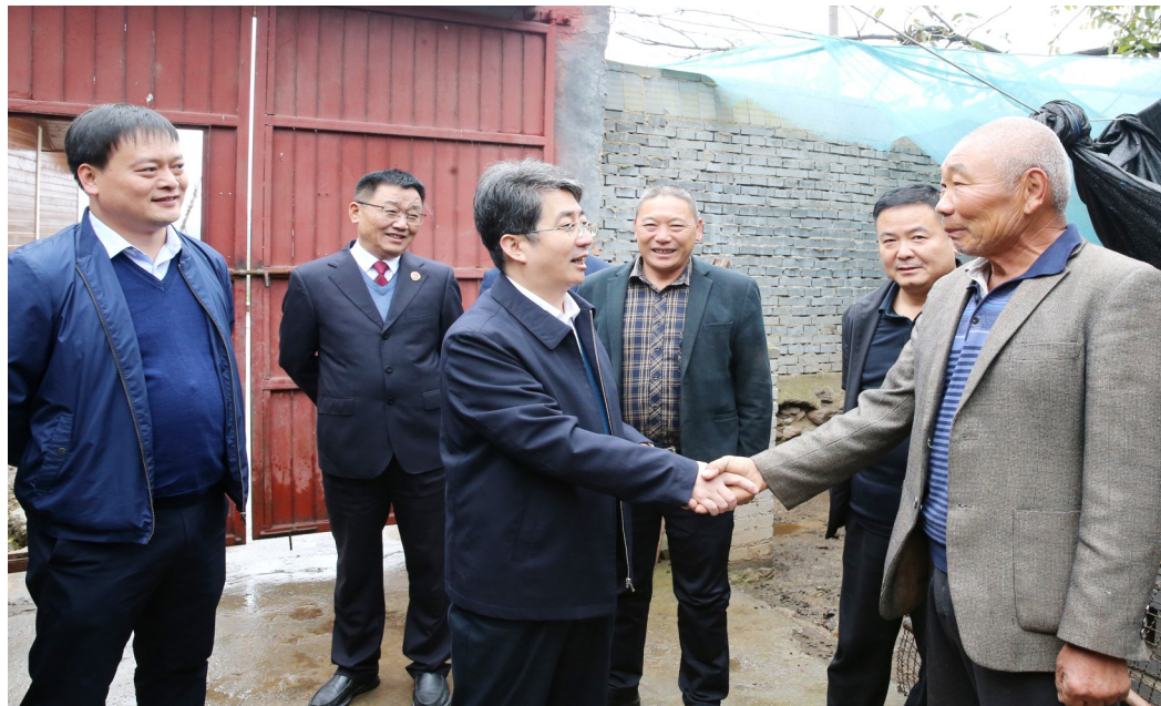
许昌市人民检察院开展“万人助企联乡帮村”活动

党史学习教育开展以来,许昌市人民检察院坚持高标准起步、高质量推进,把学习党史与政法队伍教育整顿结合起来,立足检察工作主责主业,学在深处、悟在新处、干在实处,深入开展“我为群众办实事”实践活动,推动党史学习教育持续走深走实,取得了明显成效,使人民群众的幸福感和安全感和获得感进一步增强。